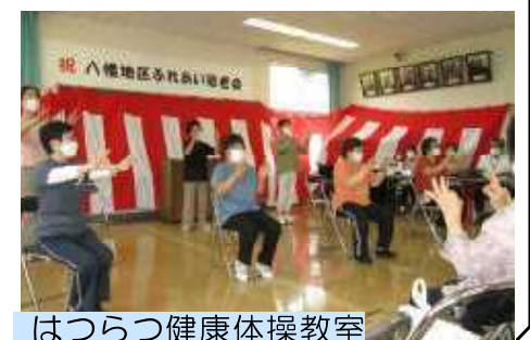
はつらつ健康体操教室