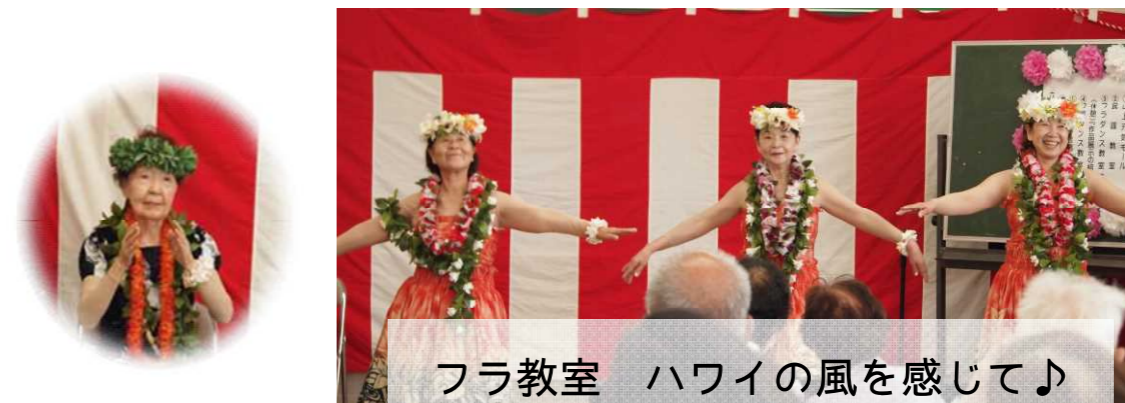
フラ教室 ハワイの風を感じて♪