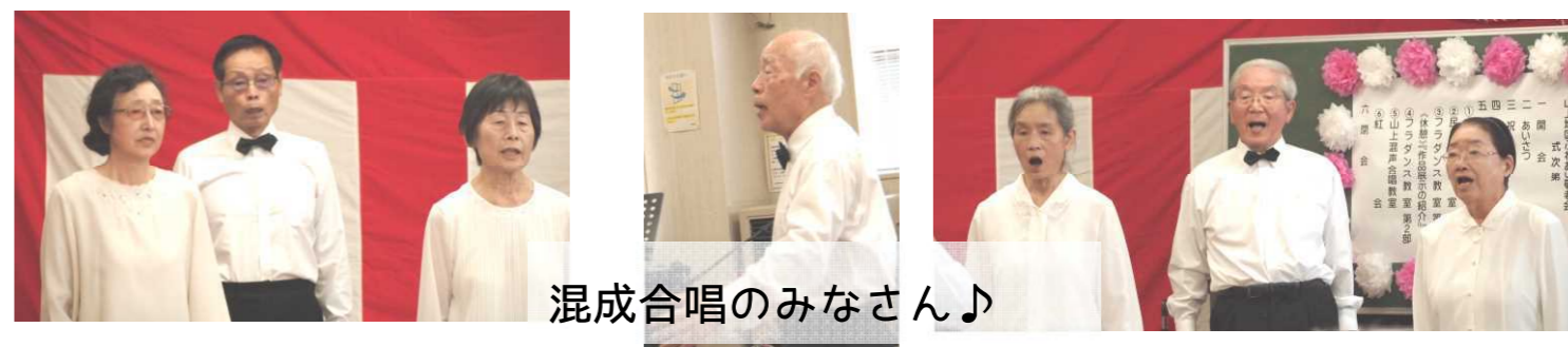
混成合唱のみなさん♪