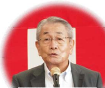
【実行委員長】 渡邊孝喜区長