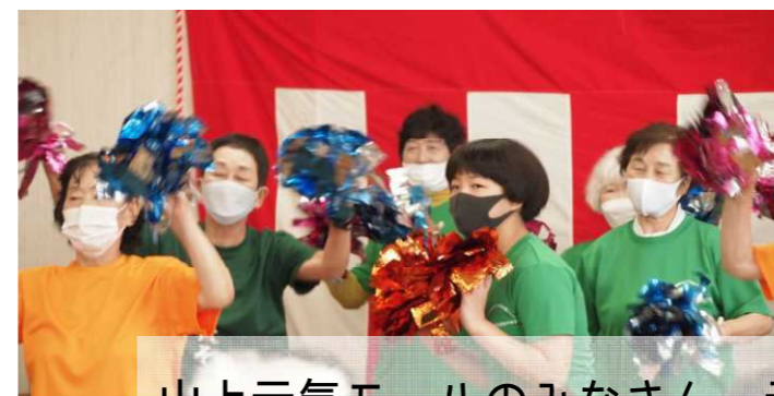
山上元気モールのみなさん 元気にキビタン体操を踊りました♪