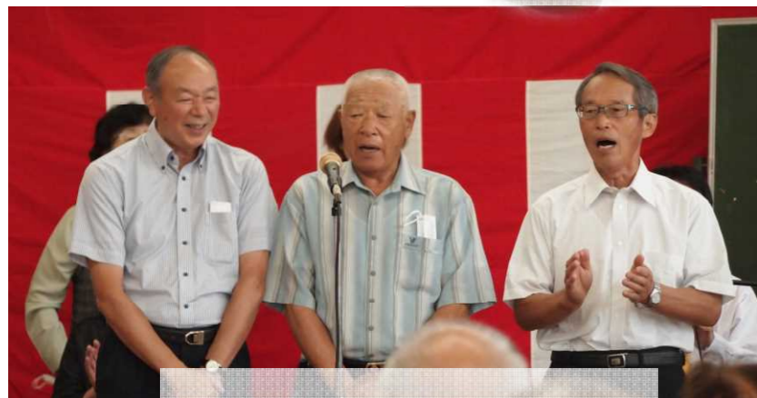
民謡教室のみなさん