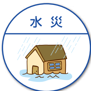
洪水や床上浸水など