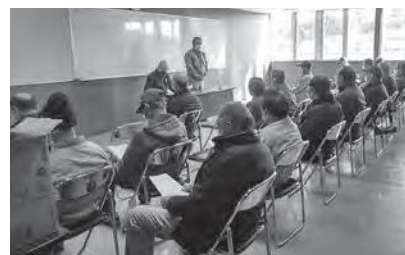
市内農家に給食用食材の生産を要請