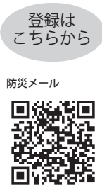
登録はこちらから 防災メール

携帯電話から、 pousai.soma@yb74.asp.cuenote.jp に空メールを送信し、リターンメールからサイトにアクセス後、画面に従い必要事項を入力し登録ください。 ※次のQRコードを読み込むとアドレスの入力を省略できます。