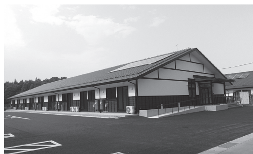
井戸端長屋 外観 (馬場野山田団地)