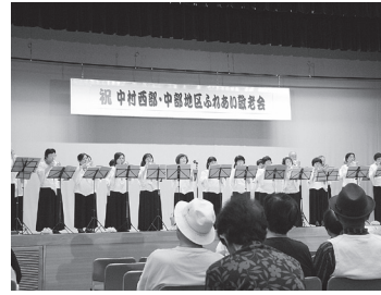
昨年のふれあい敬老会 (はまなす館)