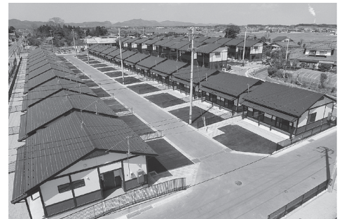
戸建 外観 (程田明神前団地)