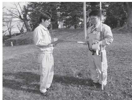
測定している様子