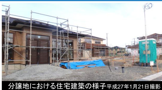
分譲地における住宅建築の様子 平成27年1月21日撮影