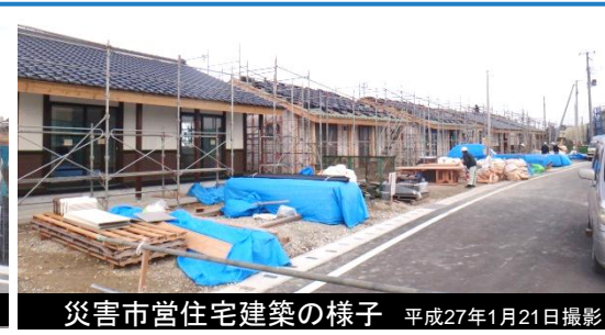
災害市営住宅建築の様子 平成27年1月21日撮影