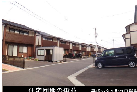
住宅団地の街並 平成27年1月21日撮影