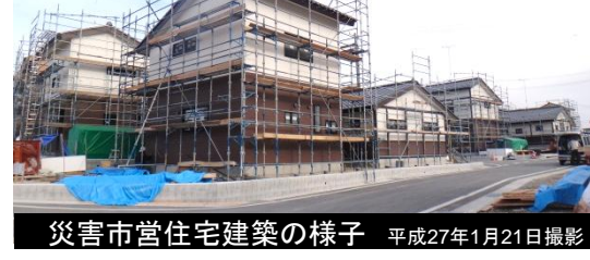
災害市営住宅建築の様子 平成27年1月21日撮影