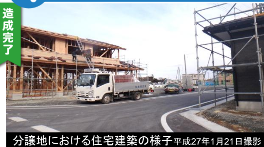
分譲地における住宅建築の様子 平成27年1月21日撮影