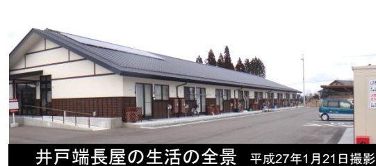
井戸端長屋の生活の全景 平成27年1月21日撮影