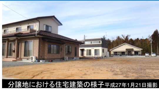
分譲地における住宅建築の様子 平成27年1月21日撮影