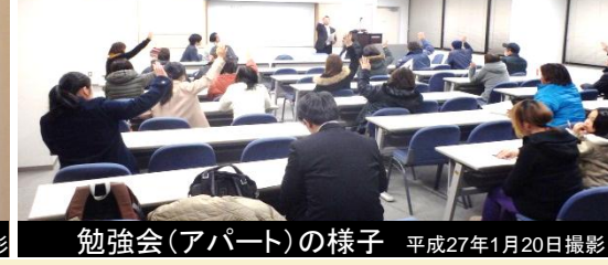
勉強会(アパート)の様子 平成27年1月20日撮影