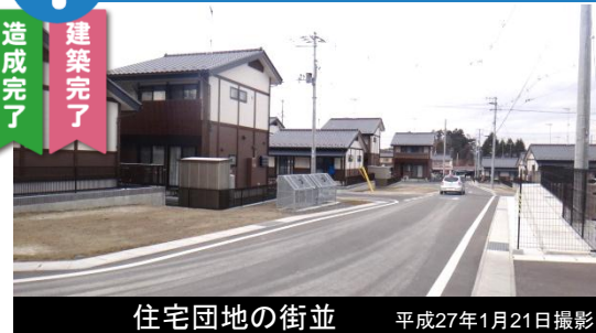
住宅団地の街並 平成27年1月21日撮影

※災害市営住宅(戸建)入居者受付中! ※井戸端長屋の入居者募集中! 造成面積: 約2.4ha