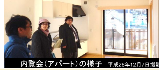
内覧会(アパート)の様子 平成26年12月7日撮影