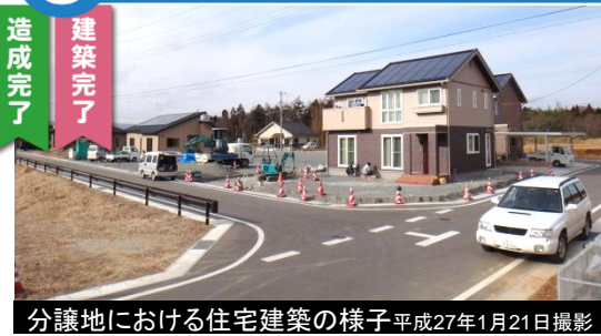
分譲地における住宅建築の様子 平成27年1月21日撮影

※住宅用地希望者受付中! ※井戸端長屋の入居者募集中! 造成面積: 約1.6ha