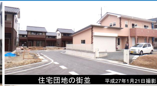
住宅団地の街並 平成27年1月21日撮影