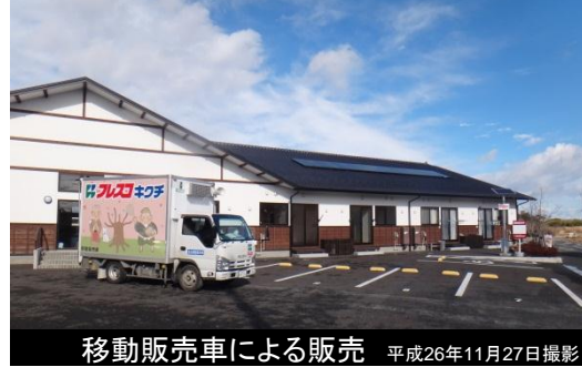
移動販売車による販売 平成26年11月27日撮影