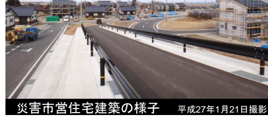
災害市営住宅建築の様子 平成27年1月21日撮影