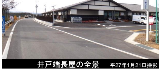
井戸端長屋の全景 平成27年1月21日撮影