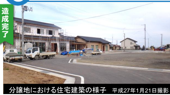
分譲地における住宅建築の様子 平成27年1月21日撮影

※災害市営住宅(戸建・平屋・二階建)入居者募集中! ※住宅用地希望者受付中! 造成面積: 約6.8ha