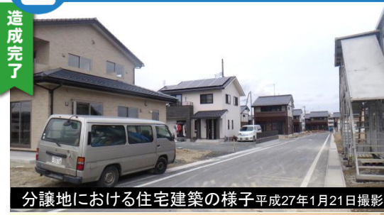
分譲地における住宅建築の様子 平成27年1月21日撮影