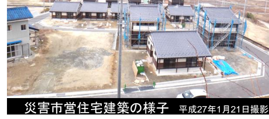
災害市営住宅建築の様子 平成27年1月21日撮影