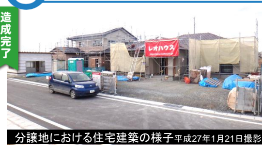
分譲地における住宅建築の様子 平成27年1月21日撮影