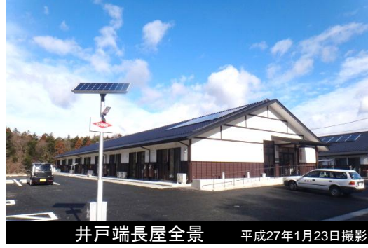
井戸端長屋全景 平成27年1月23日撮影