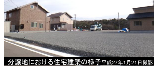
分譲地における住宅建築の様子 平成27年1月21日撮影