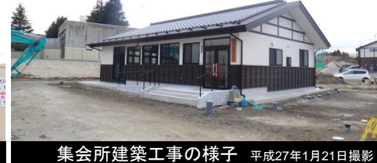
集会所建築工事の様子 平成27年1月21日撮影