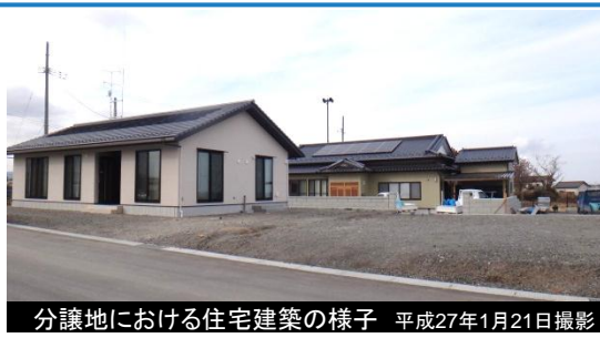
分譲地における住宅建築の様子 平成27年1月21日撮影