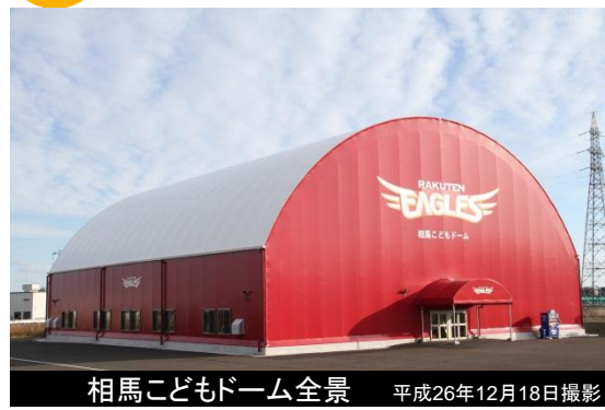
相馬こどもドーム全景 平成26年12月18日撮影