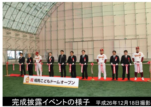
完成披露イベントの様子 平成26年12月18日撮影

相馬こどもドームは、面積約1,200㎡(30m×40m)高さ15m(最大)の砂入り人工芝のテント型屋内ドームです。 同施設は、宮城県に本拠地を置く楽天野球団が中心となって設立した「屋内スポーツ施設建設募金団体」が施設建設のために全国から寄せられた募金により建設され、平成26年12月18日完成披露イベントが開かれました。