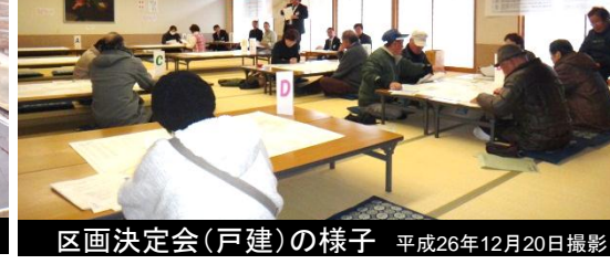
区画決定会(戸建)の様子 平成26年12月20日撮影