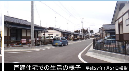
戸建住宅での生活の様子 平成27年1月21日撮影