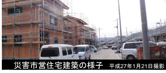
災害市営住宅建築の様子 平成27年1月21日撮影