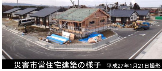
災害市営住宅建築の様子 平成27年1月21日撮影