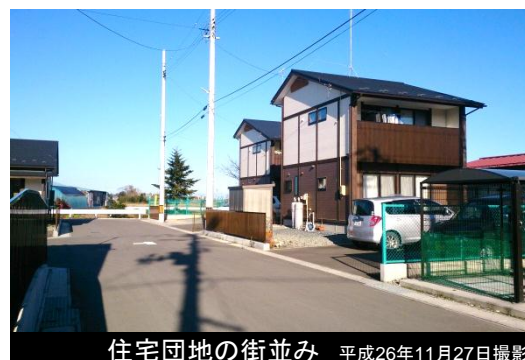
住宅団地の街並み 平成26年11月27日撮影