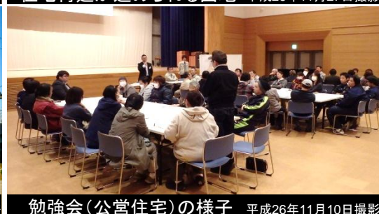
勉強会(公営住宅)の様子 平成26年11月10日撮影