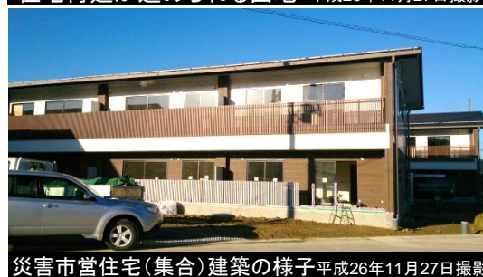
災害市営住宅(集合)建築の様子 平成26年11月27日撮影