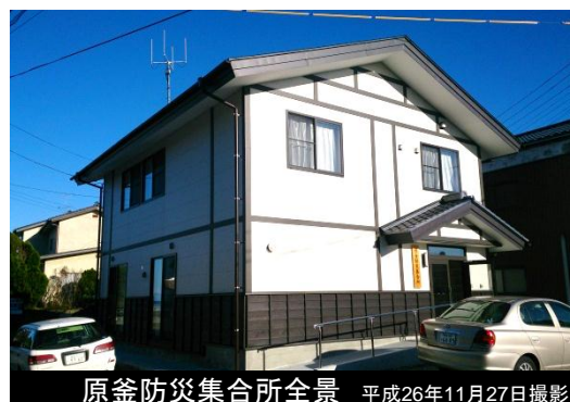
原釜防災集合所全景 平成26年11月27日撮影

市内に整備されている防災集合所のうち、10施設目となる原釜防災集合所は8月2日、落成式を迎えました。 原釜地区において、災害時の初期段階での避難活動、消防活動等のコミュニティ活動の拠点となるべき施設で、災害に備え水や暖房器具、簡易発電機等を備蓄する倉庫も備えています。 原釜防災集合所は木造一部鉄骨造り2階建てです。