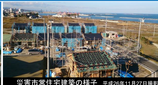
災害市営住宅建築の様子 平成26年11月27日撮影