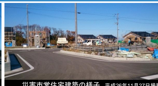
災害市営住宅建築の様子 平成26年11月27日撮影