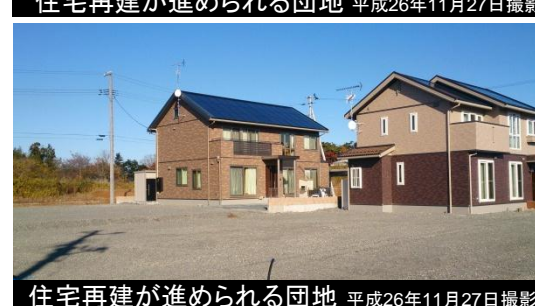
住宅再建が進められる団地 平成26年11月27日撮影