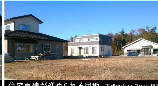
住宅再建が進められる団地 平成26年11月27日撮影