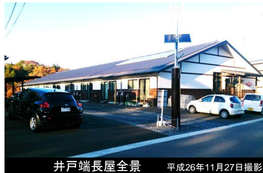
井戸端長屋全景 平成26年11月27日撮影