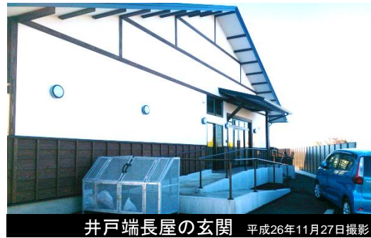
井戸端長屋の玄関 平成26年11月27日撮影