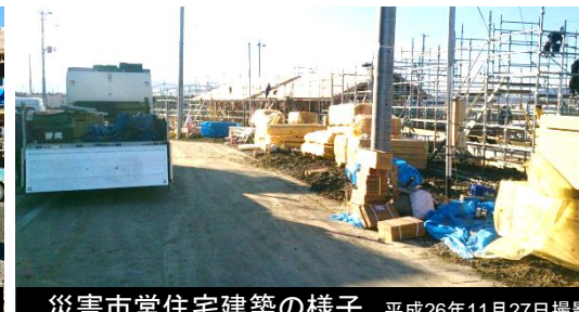
災害市営住宅建築の様子 平成26年11月27日撮影