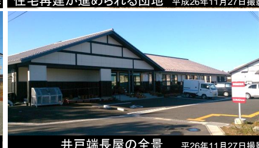
井戸端長屋の全景 平成26年11月27日撮影