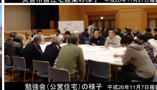
勉強会(公営住宅)の様子 平成26年11月7日撮影