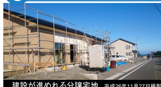
建設が進められる分譲宅地 平成26年11月27日撮影

※災害市営住宅(戸建・平屋・二階建)入居者募集中! ※住宅用地希望者受付中! 造成面積: 約6.8ha