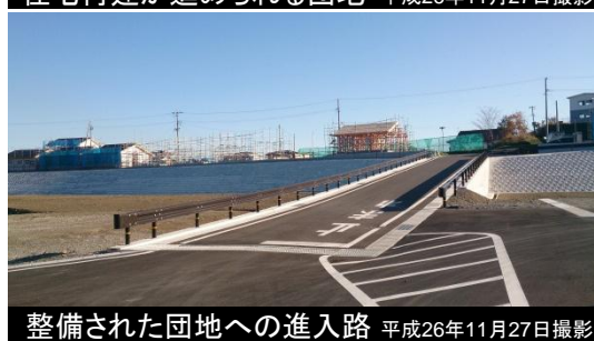
整備された団地への進入路 平成26年11月27日撮影