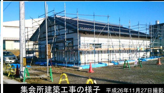
集会所建築工事の様子 平成26年11月27日撮影