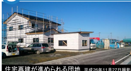
住宅再建が進められる団地 平成26年11月27日撮影