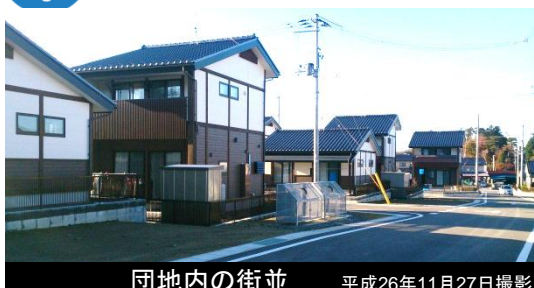
団地内の街並 平成26年11月27日撮影

※災害市営住宅(戸建)入居者受付中! ※井戸端長屋の入居者募集中! 造成面積: 約2.4ha