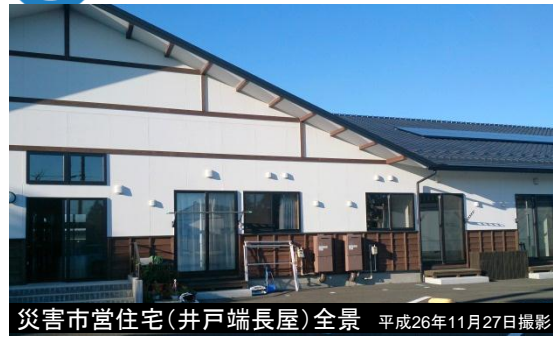
災害市営住宅(井戸端長屋)全景 平成26年11月27日撮影