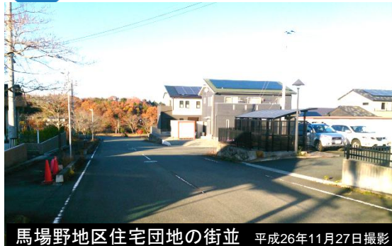
馬場野地区住宅団地の街並 平成26年11月27日撮影