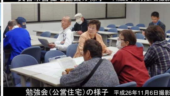
勉強会(公営住宅)の様子 平成26年11月6日撮影