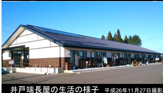
井戸端長屋の生活の様子 平成26年11月27日撮影