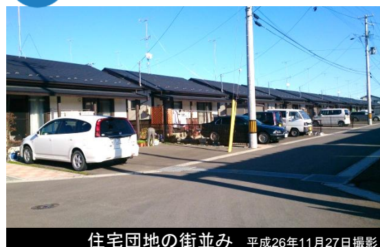
住宅団地の街並み 平成26年11月27日撮影