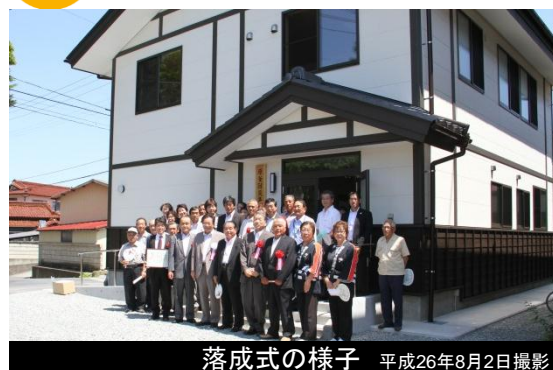
落成式の様子 平成26年8月2日撮影