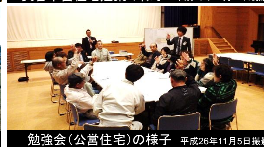
勉強会(公営住宅)の様子 平成26年11月5日撮影