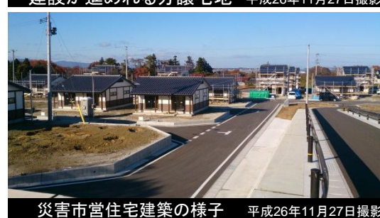
災害市営住宅建築の様子 平成26年11月27日撮影