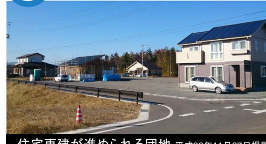
住宅再建が進められる団地 平成26年11月27日撮影

※住宅用地希望者受付中! ※井戸端長屋の入居者募集中! 造成面積: 約1.6ha