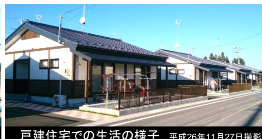
戸建住宅での生活の様子 平成26年11月27日撮影