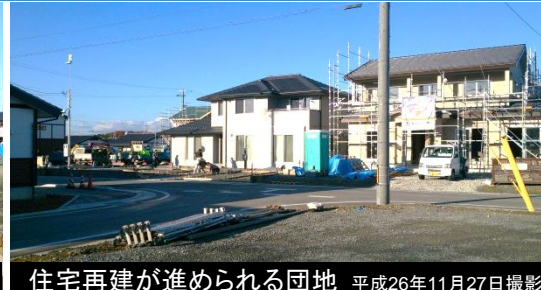
住宅再建が進められる団地 平成26年11月27日撮影