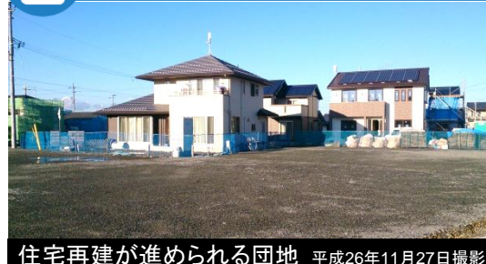
住宅再建が進められる団地 平成26年11月27日撮影