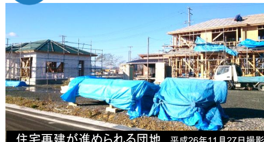
住宅再建が進められる団地 平成26年11月27日撮影