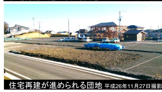
住宅再建が進められる団地 平成26年11月27日撮影