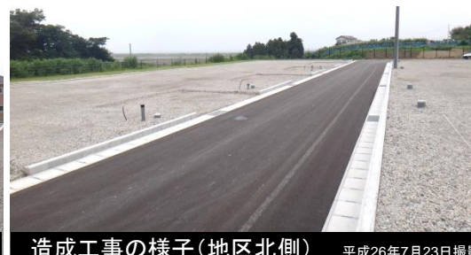
造成工事の様子(地区北側) 平成26年7月23日撮影