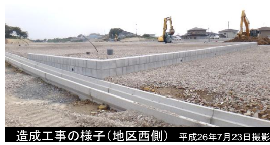
造成工事の様子(地区西側) 平成26年7月23日撮影