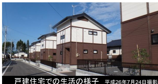
戸建住宅での生活の様子 平成26年7月24日撮影