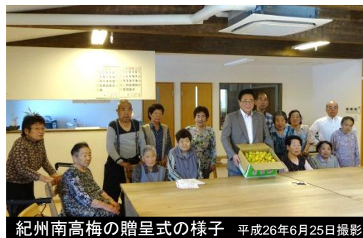
紀州南高梅の贈呈式の様子 平成26年6月25日撮影