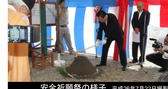
安全祈願祭の様子 平成26年7月22日撮影