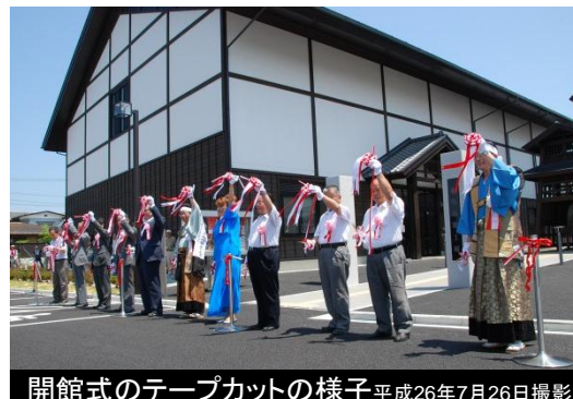
開館式のテープカットの様子 平成26年7月26日撮影