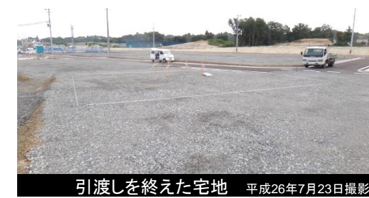
引渡しを終えた宅地 平成26年7月23日撮影