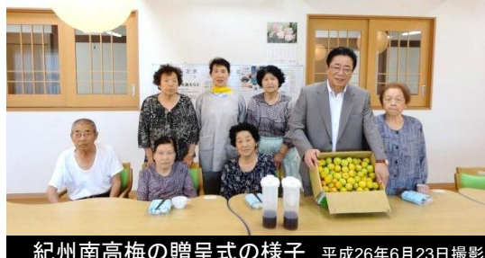
紀州南高梅の贈呈式の様子 平成26年6月23日撮影