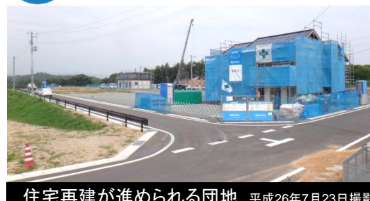
住宅再建が進められる団地 平成26年7月23日撮影