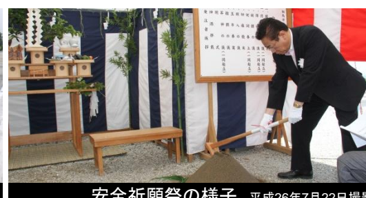
安全祈願祭の様子 平成26年7月22日撮影