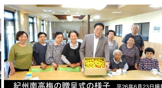
紀州南高梅の贈呈式の様子 平成26年6月23日撮影