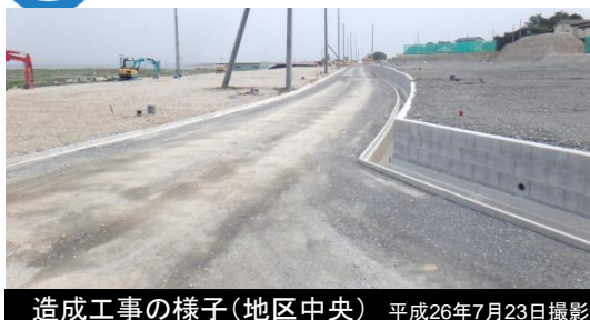
造成工事の様子(地区中央) 平成26年7月23日撮影