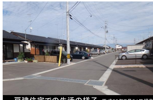
戸建住宅での生活の様子 平成26年7月24日撮影