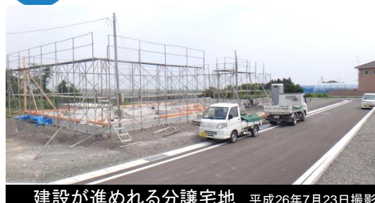
建設が進めれる分譲宅地 平成26年7月23日撮影