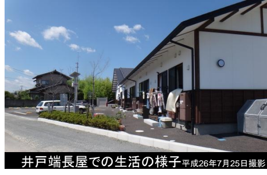
井戸端長屋での生活の様子 平成26年7月25日撮影