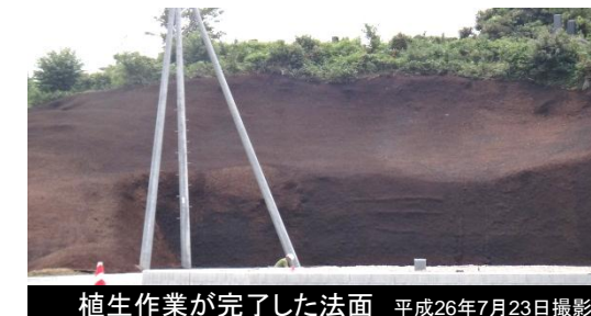
植生作業が完了した法面 平成26年7月23日撮影