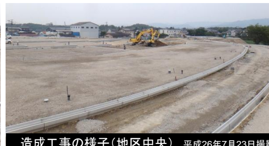
造成工事の様子(地区中央) 平成26年7月23日撮影