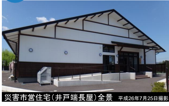
災害市営住宅(井戸端長屋)全景 平成26年7月25日撮影