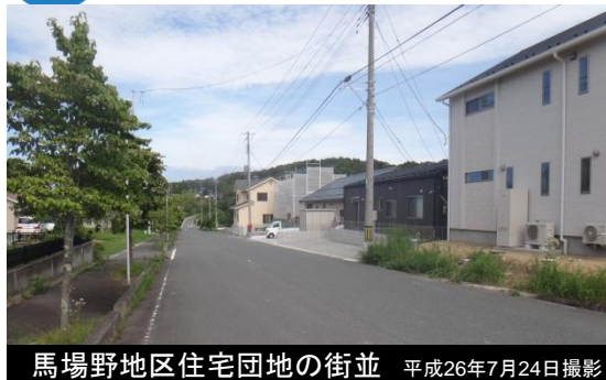
馬場野地区住宅団地の街並 平成26年7月24日撮影