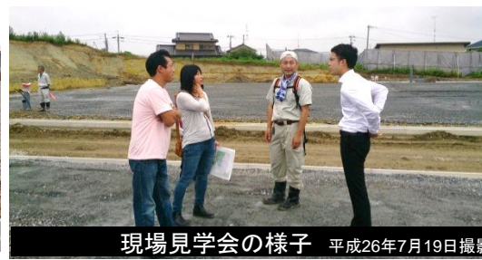
現場見学会の様子 平成26年7月19日撮影