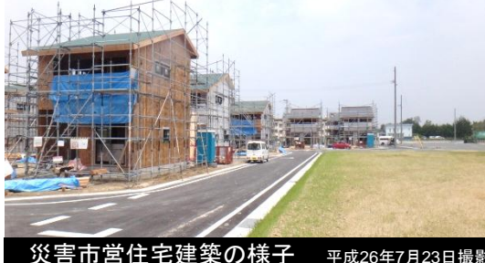
災害市営住宅建築の様子 平成26年7月23日撮影