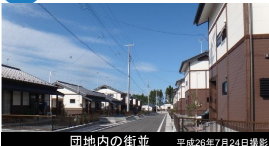
団地内の街並 平成26年7月24日撮影

※災害市営住宅(戸建)入居者受付中! ※井戸端長屋の入居者募集中! 造成面積: 約2.4ha