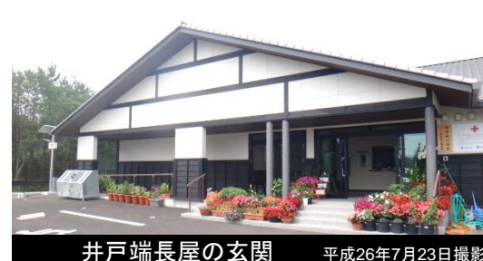
井戸端長屋の玄関 平成26年7月23日撮影