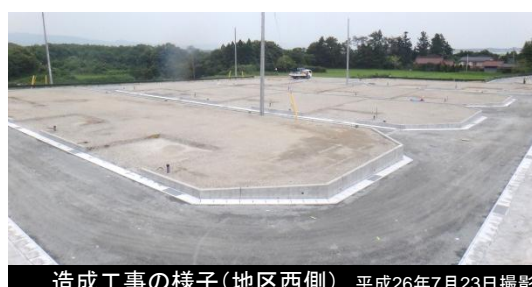
造成工事の様子(地区西側) 平成26年7月23日撮影