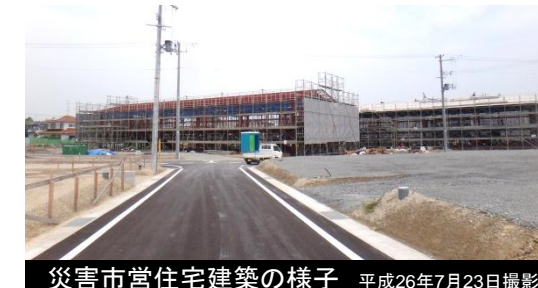
災害市営住宅建築の様子 平成26年7月23日撮影