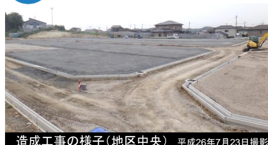
造成工事の様子(地区中央) 平成26年7月23日撮影