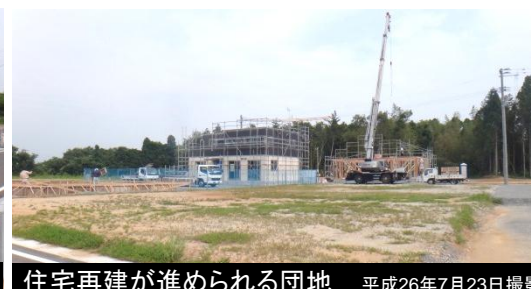
住宅再建が進められる団地 平成26年7月23日撮影