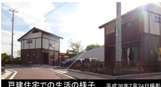
戸建住宅での生活の様子 平成26年7月24日撮影