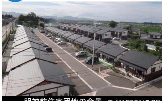
明神前住宅団地の全景 平成26年7月24日撮影