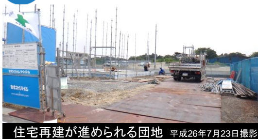
住宅再建が進められる団地 平成26年7月23日撮影