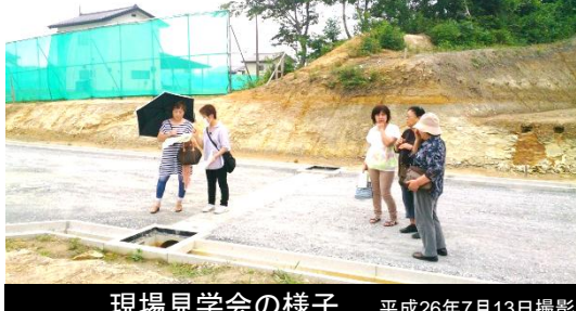
現場見学会の様子 平成26年7月13日撮影