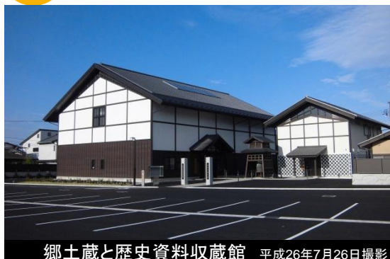
郷土蔵と歴史資料収蔵館 平成26年7月26日撮影