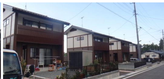
戸建住宅での生活の様子 平成26年5月28日撮影