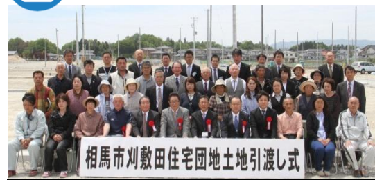
土地引渡し式 集合写真 平成26年5月12日撮影