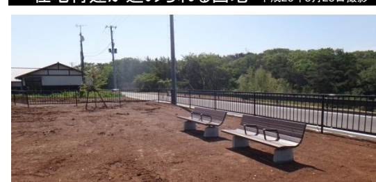
団地内の公園 平成26年5月28日撮影