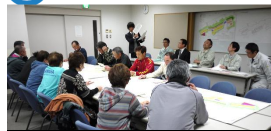
第5回勉強会(宅地)の様子 平成26年4月23日撮影