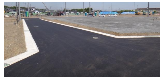
舗装工事が完了した道路 平成26年5月28日撮影