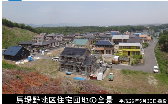
馬場野地区住宅団地の全景 平成26年5月30日撮影