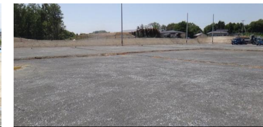
砕石が敷かれた宅地 平成26年5月28日撮影