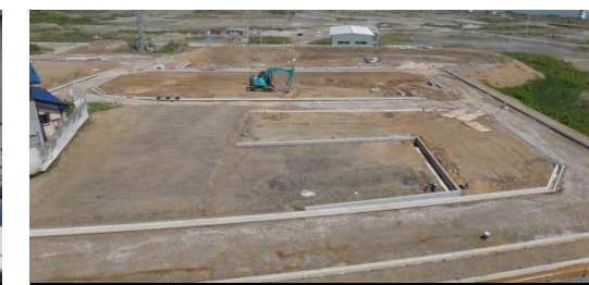
造成工事の様子(地区東側) 平成26年5月28日撮影