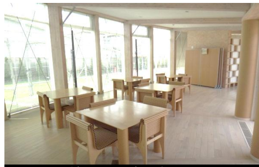
LVMH子どもアート・メゾン内観 平成26年5月30日撮影

子どもたちの心のケアや情操教育、学力向上などの拠点となる『相馬市LVMH子どもアート・メゾン』のプレオープンセレモニーが3月31日行われました。