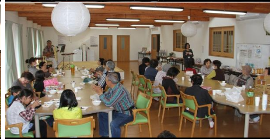
出発の集いの様子 平成26年5月12日撮影