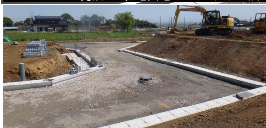
造成工事の様子(公営住宅用地) 平成26年5月28日撮影