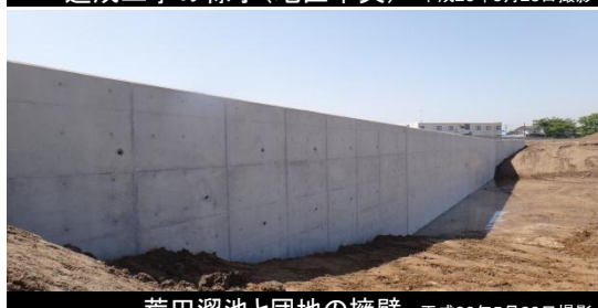
荒田溜池と団地の擁壁 平成26年5月28日撮影