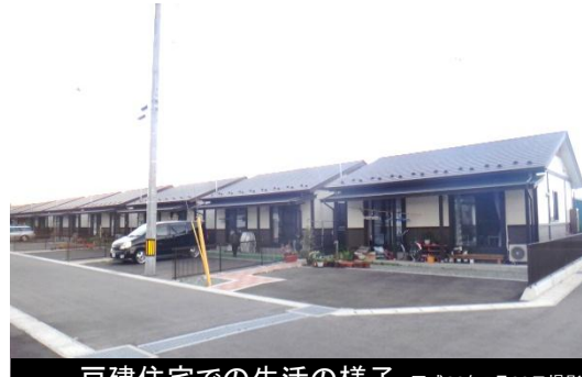
戸建住宅での生活の様子 平成26年5月28日撮影