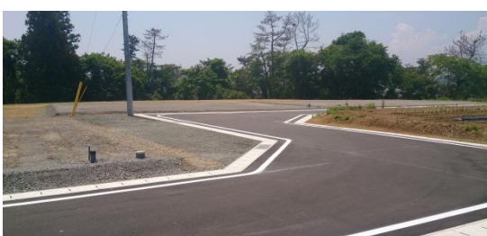
完成した住宅団地 平成26年5月29日撮影