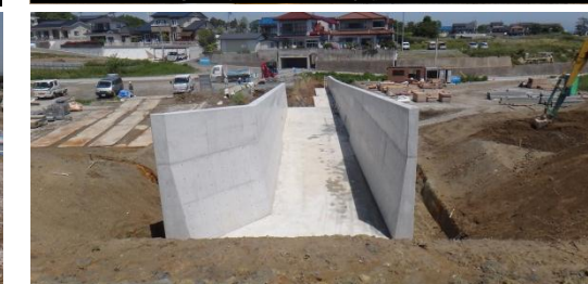
摂院へ繋がる道路の整備の様子 平成26年5月28日撮影