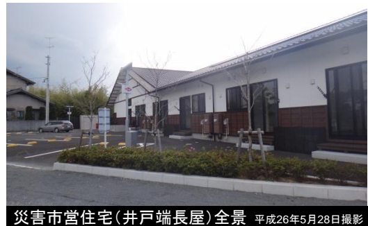
災害市営住宅(井戸端長屋)全景 平成26年5月28日撮影