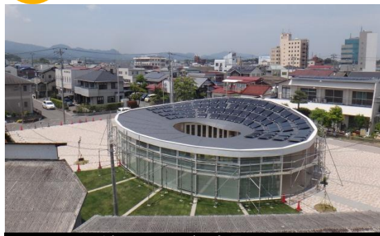
LVMH子どもアート・メゾン全景 平成26年5月30日撮影