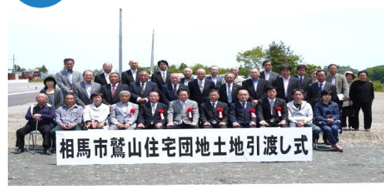
土地引渡し式 集合写真 平成26年5月24日撮影