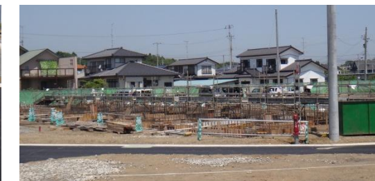
災害公営住宅建築の様子 平成26年5月28日撮影