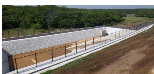
整備された調整池 平成26年5月28日撮影