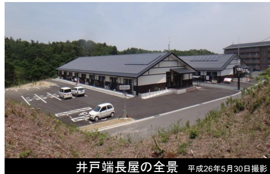
井戸端長屋の全景 平成26年5月30日撮影