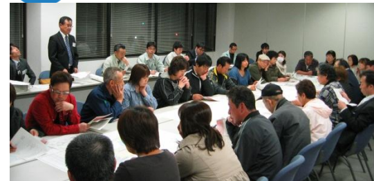
第7回勉強会(宅地)の様子 平成26年4月22日撮影