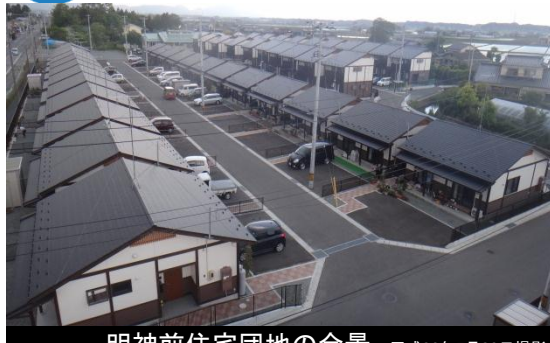
明神前住宅団地の全景 平成26年5月28日撮影