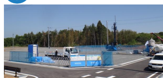
住宅再建が進められる団地 平成26年5月28日撮影