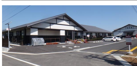
井戸端長屋の全景 平成26年5月28日撮影