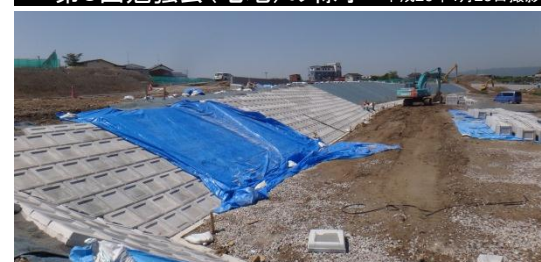
擁壁工事の様子 平成26年5月28日撮影