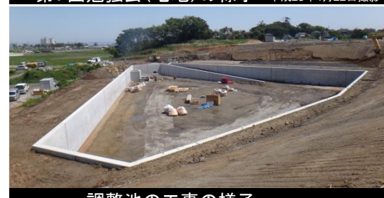
調整池の工事の様子 平成26年5月28日撮影