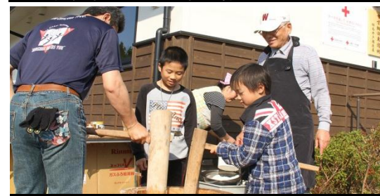
出発のつどいの様子 平成26年5月12日撮影