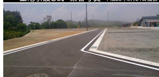
完成した住宅団地 平成26年5月29日撮影