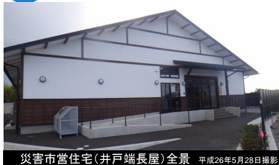
災害市営住宅(井戸端長屋)全景 平成26年5月28日撮影