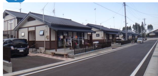
戸建住宅での生活の様子 平成26年5月28日撮影

※災害市営住宅(戸建)入居者受付中! ※井戸端長屋の入居者募集中! 造成面積: 約2.4ha