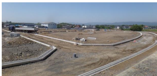
造成工事の様子(地区中央) 平成26年5月28日撮影