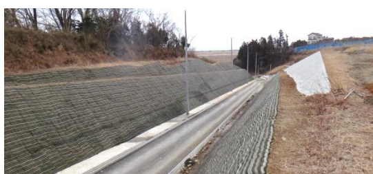
県道から団地への道(地区北側) 平成26年3月19日撮影