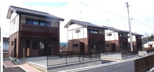
完成した戸建住宅(二階建) 平成26年3月19日撮影