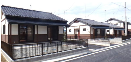
完成した戸建住宅(平屋) 平成26年3月19日撮影