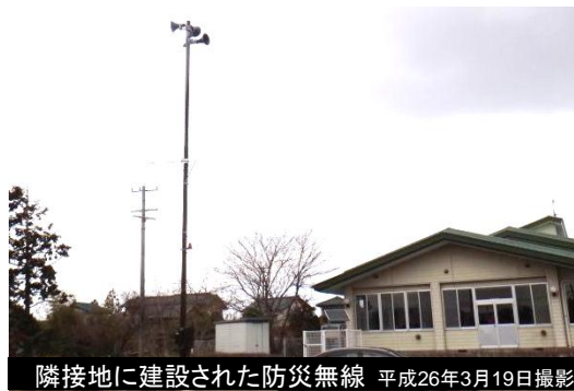
隣接地に建設された防災無線 平成26年3月19日撮影