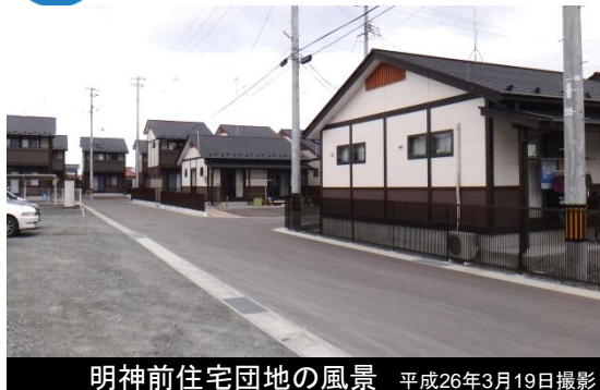
明神前住宅団地の風景 平成26年3月19日撮影