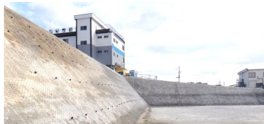
法面工事の様子(地区西側) 平成26年3月19日撮影