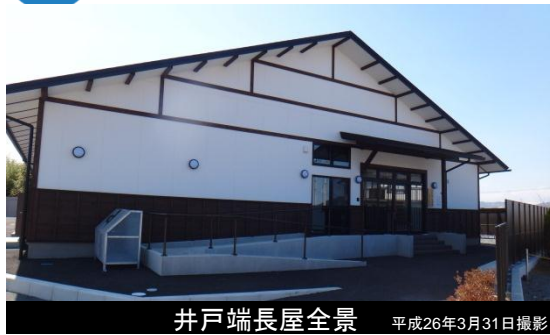
井戸端長屋全景 平成26年3月31日撮影