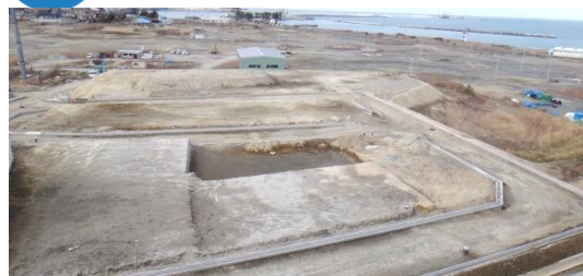
宅盤の整備状況(地区東側) 平成26年3月19日撮影