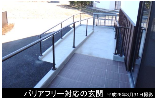
バリアフリー対応の玄関 平成26年3月31日撮影