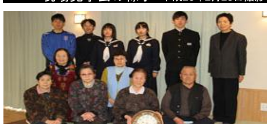
井戸端長屋に寄付された壁時計 平成26年3月12日撮影