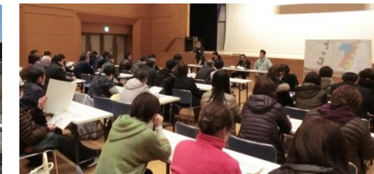
第五回勉強会(宅地)の様子 平成26年2月27日撮影