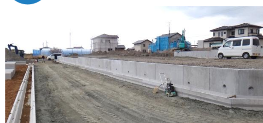
造成工事の状況(地区東側) 平成26年3月19日撮影