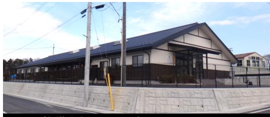
整備された井戸端長屋 平成26年3月19日撮影