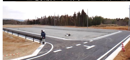
整備が完了した住宅団地 平成26年3月19日撮影