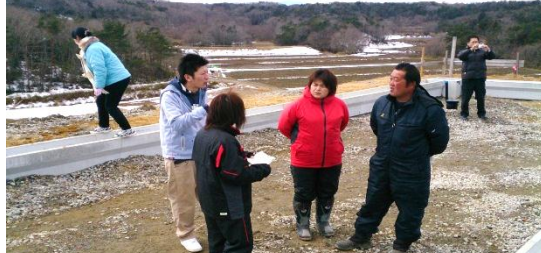
現場見学会の様子 平成26年2月23日撮影