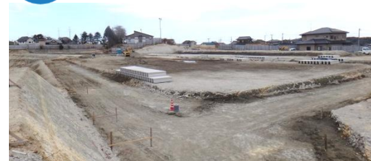
造成工事の様子(地区中央) 平成26年3月19日撮影