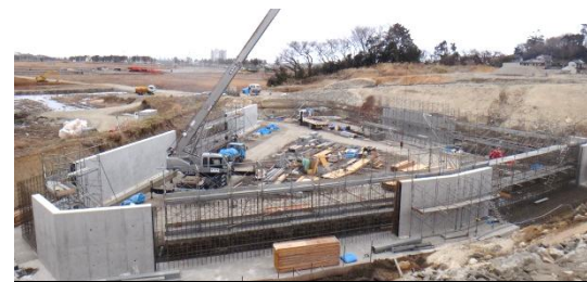
造成工事の様子(調整池) 平成26年3月19日撮影