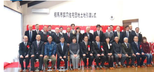
土地引渡しの様子 平成26年3月20日撮影