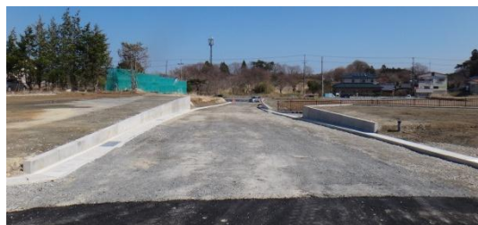
県道からの接続道路の整備状況 平成26年3月31日撮影