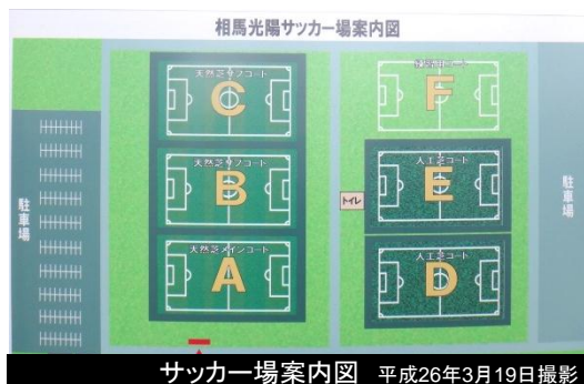
サッカー場案内図 平成26年3月19日撮影

FIFAとJFAの支援を受け、天然芝コート3面と人工芝コート1面が、平成25年10月18日にリニューアルオープンしました。 人工芝コート1面を新たに整備し、toto助成金を活用し、人工芝コート1面には夜間照明を完備、平成26年8月までに復興交流支援センターを整備し、運動能力の向上はもちろん、交流を深めることができる施設です。