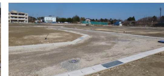
宅盤(住宅用地)の整備状況 平成26年3月31日撮影