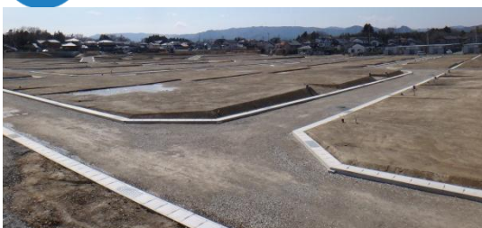
宅盤(住宅用地)の整備状況 平成26年3月31日撮影