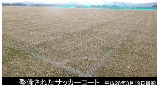
整備されたサッカーコート 平成26年3月19日撮影