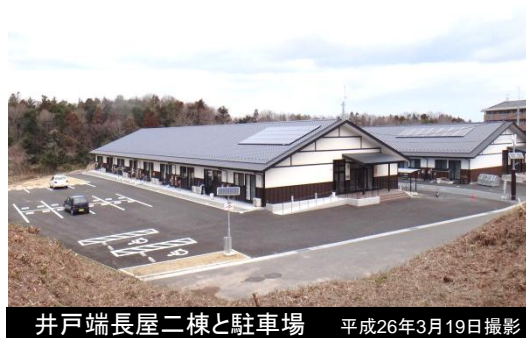
井戸端長屋二棟と駐車場 平成26年3月19日撮影