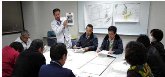
第六回勉強会(宅地)の様子 平成26年2月28日撮影