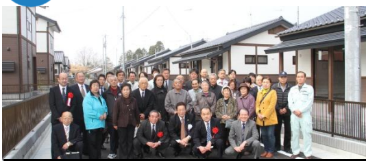
後期入居地区鍵引渡しの様子 平成26年3月28日撮影