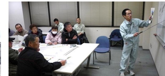
第四回勉強会(宅地)の様子 平成26年2月27日撮影