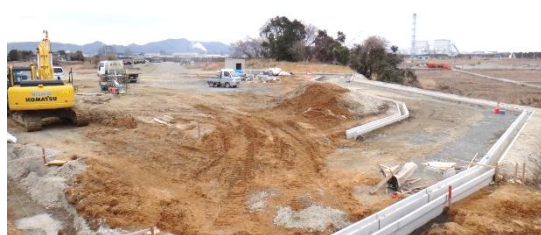
造成工事の様子(地区東側) 平成26年3月19日撮影