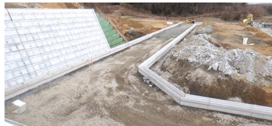
造成工事の様子(地区西側) 平成26年3月19日撮影