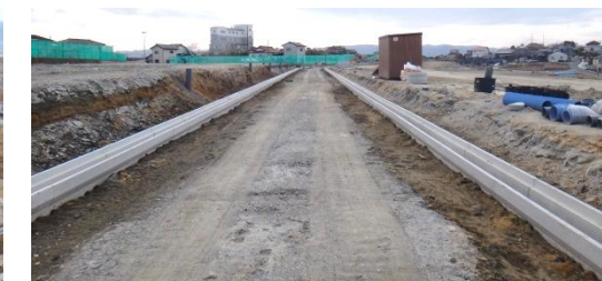
道路の整備状況(地区中央) 平成26年3月19日撮影