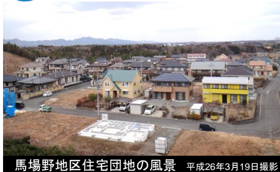
馬場野地区住宅団地の風景 平成26年3月19日撮影