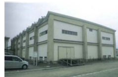
※震災前の写真 (現在は既に取壊済)