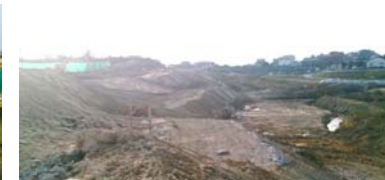
造成工事の様子(地区西側) 平成25年11月18日撮影