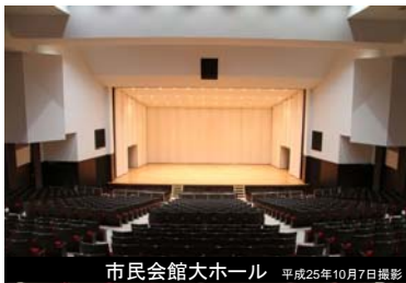
市民会館大ホール 平成25年10月7日撮影

平成25年10月7日に、「相馬市復興と市民団結のシンボル」となる、新相馬市民会館の落成式が、太田国土交通大臣をはじめ、多くの市民が出席する中行われました。922席の大ホール、多目的ホール、楽屋、会議室等を備え、玄関ロビーは展示会にも使用可能です。250台の駐車場を備えています。