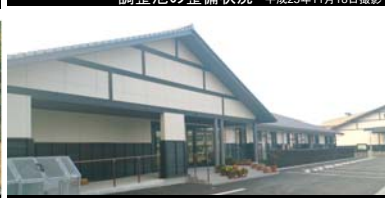
井戸端長屋の正面玄関 平成25年11月18日撮影