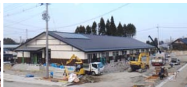
建築工事の様子(井戸端長屋) 平成25年11月18日撮影