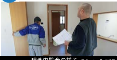
現地内覧会の様子 平成25年11月2日撮影