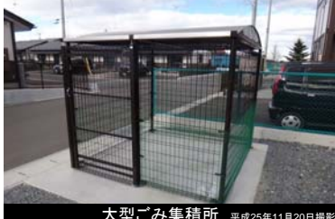
大型ごみ集積所 平成25年11月20日撮影