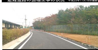
団地への道路の整備状況 平成25年11月18日撮影