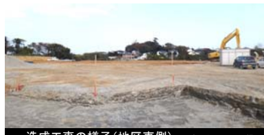
造成工事の様子(地区東側) 平成25年11月18日撮影