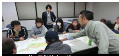
第4回勉強会の様子 平成25年11月14日撮影