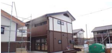
戸建住宅(二階建)の建築状況 平成25年11月18日撮影