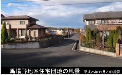
馬場野山田地区住宅団地の風景 平成25年11月20日撮影