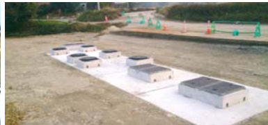
合併浄化槽の整備(地区北側) 平成25年11月18日撮影