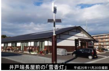
井戸端長屋前の「雪香灯」 平成25年11月20日撮影