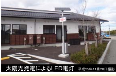
太陽光発電によるLED電灯 平成25年11月20日撮影