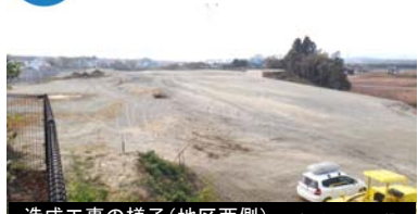
造成工事の様子(地区西側) 平成25年11月18日撮影