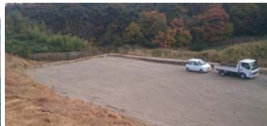
調整池の整備状況 平成25年11月18日撮影