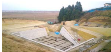
調整池の工事の様子(地区北側) 平成25年11月18日撮影