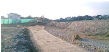
区画道路の整備工事の状況 平成25年11月18日撮影