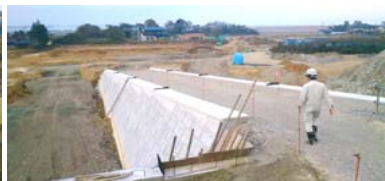
市道へ抜ける道路の整備状況 平成25年11月18日撮影