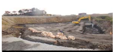
造成工事の様子(調整池) 平成25年11月18日撮影