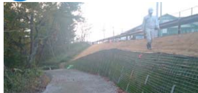
避難道路の拡幅工事の状況 平成25年11月18日撮影