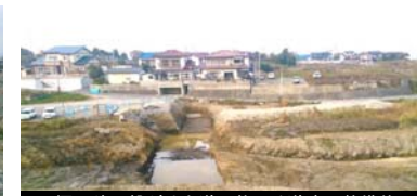
撮取院に繋がる市道へ抜ける道路の整備状況 平成25年11月18日撮影