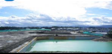
造成工事の全体状況 平成25年10月29日撮影