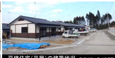
戸建住宅(平屋)の建築状況 平成25年11月18日撮影