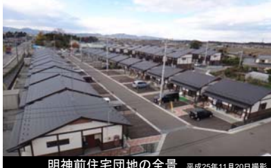
明神前住宅団地の全景 平成25年11月20日撮影