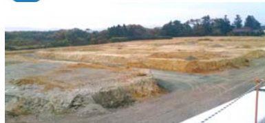
造成工事の状況(地区南西側) 平成25年11月18日撮影