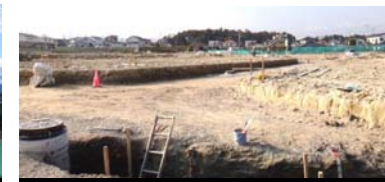
宅地の整備状況 平成25年11月18日撮影