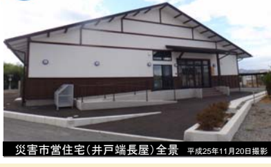
災害市営住宅(井戸端長屋)全景 平成25年11月20日撮影