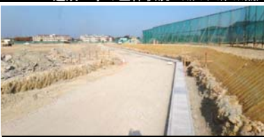
区画道路の整備工事の状況 平成25年11月18日撮影