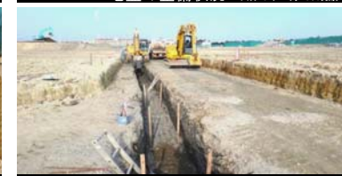
造成工事の様子 平成25年11月18日撮影