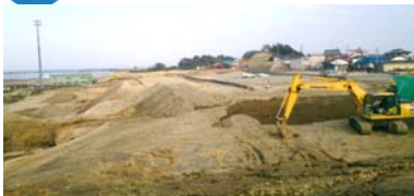
造成工事の様子(地区東側) 平成25年11月18日撮影