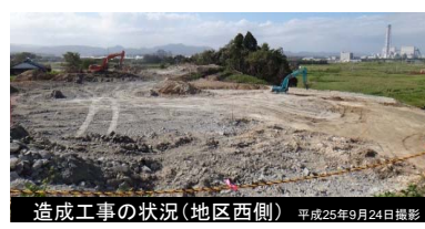
造成工事の状況(地区西側) 平成25年9月24日撮影