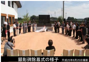
顕彰碑除幕式の様子 平成25年8月25日撮影

平成25年8月25日に、落成式を実施し、合わせて、殉職消防団員の顕彰碑の除幕式を実施いたしました。顕彰碑は、震災で殉職された10名の消防団員の功績を永久的に称えるものです。防災備蓄倉庫は、市民からの応募により、「相馬兵糧蔵」の愛称が決定しました。