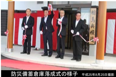
防災備蓄倉庫落成式の様子 平成25年8月25日撮影