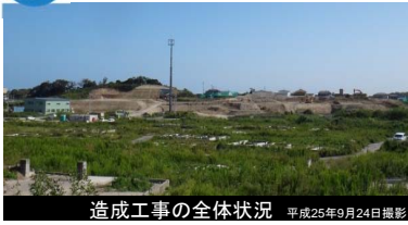
造成工事の全体状況 平成25年9月24日撮影