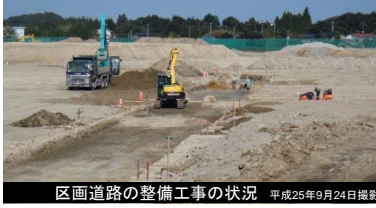
区画道路の整備工事の状況 平成25年9月24日撮影