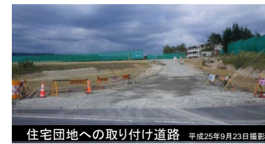
住宅団地への取り付け道路 平成25年9月23日撮影