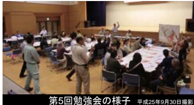
第5回勉強会の様子 平成25年9月30日撮影