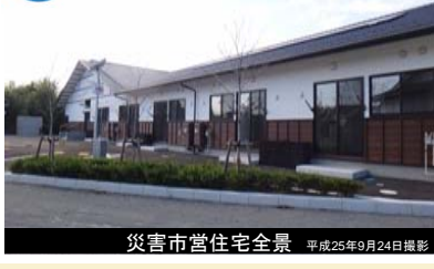
災害市営住宅全景 平成25年9月24日撮影