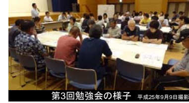
第3回勉強会の様子 平成25年9月9日撮影