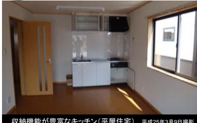
収納機能が豊富なキッチン(平屋住宅) 平成25年3月9日撮影