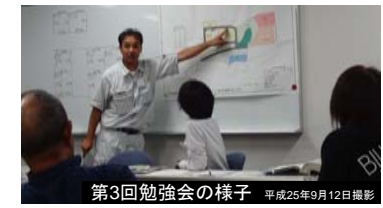
第3回勉強会の様子 平成25年9月12日撮影