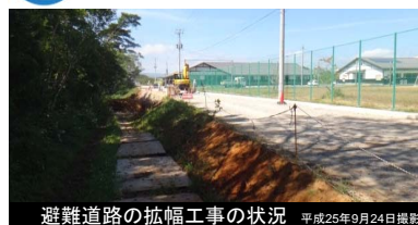
避難道路の拡幅工事の状況 平成25年9月24日撮影