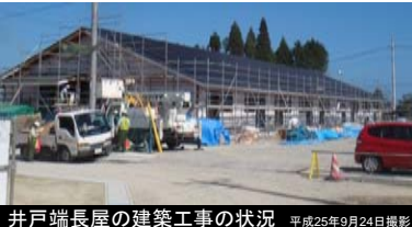
井戸端長屋の建築工事の状況 平成25年9月24日撮影