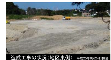
造成工事の状況(地区東側) 平成25年9月24日撮影