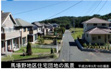
馬場野地区住宅団地の風景 平成25年9月18日撮影