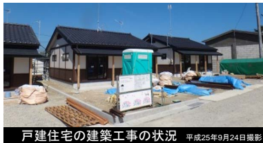
戸建住宅の建築工事の状況 平成25年9月24日撮影