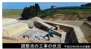
調整池の工事の状況 平成25年9月24日撮影