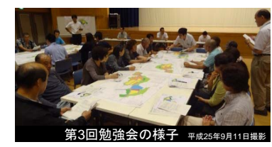
第3回勉強会の様子 平成25年9月11日撮影