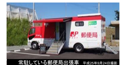
常駐している郵便局出張車 平成25年9月24日撮影