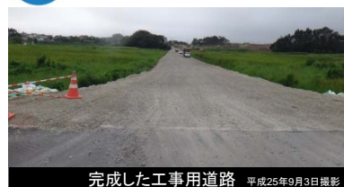
完成した工食用道路 平成25年9月3日撮影