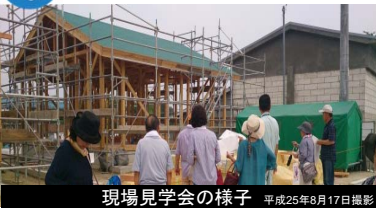
現場見学会の様子 平成25年8月17日撮影