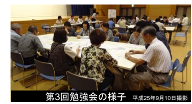
第3回勉強会の様子 平成25年9月10日撮影