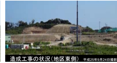
造成工事の状況(地区東側) 平成25年9月24日撮影