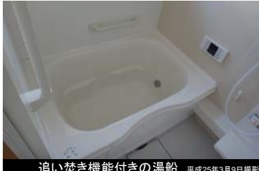
追い焚き機能付きの湯船 平成25年3月9日撮影