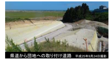
県道から団地への取り付け道路 平成25年9月24日撮影