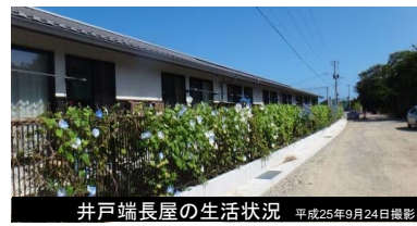
井戸端長屋の生活状況 平成25年9月24日撮影