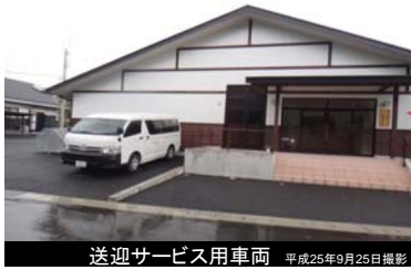
送迎サービス用車両 平成25年9月25日撮影