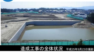
造成工事の全体状況 平成25年9月23日撮影