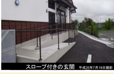
スロープ付きの玄関 平成25年7月18日撮影