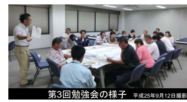
第3回勉強会の様子 平成25年9月12日撮影