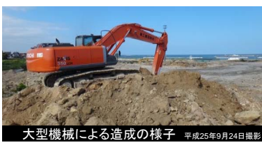
大型機械による造成の様子 平成25年9月24日撮影