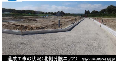
造成工事の状況(北側分譲エリア) 平成25年9月24日撮影