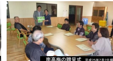
南高梅の贈呈式 平成25年7月2日撮影