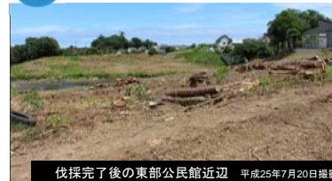
伐採完了後の東部公民館近辺 平成25年7月20日撮影