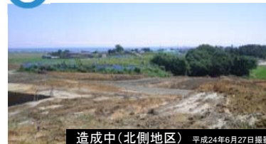
造成中(北側地区) 平成24年6月27日撮影