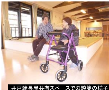
井戸端長屋共有スペースでの談笑の様子