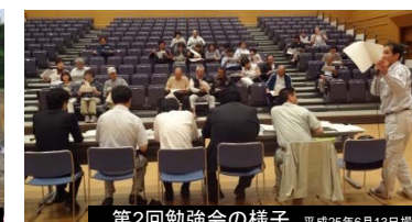
第2回勉強会の様子 平成25年6月13日撮影