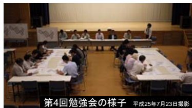
第4回勉強会の様子 平成25年7月23日撮影