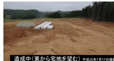
造成中(東から宅地を望む) 平成25年7月17日撮影