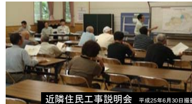
近隣住民工事説明会 平成25年6月30日撮影