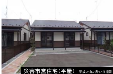
災害市営住宅(平屋) 平成25年7月17日撮影