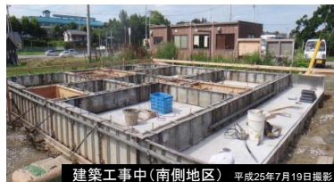
建築工事中(南側地区) 平成25年7月19日撮影