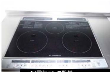
IH電気コンロ設備 平成25年3月26日撮影