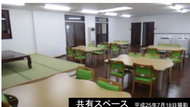
共有スペース 平成25年7月18日撮影