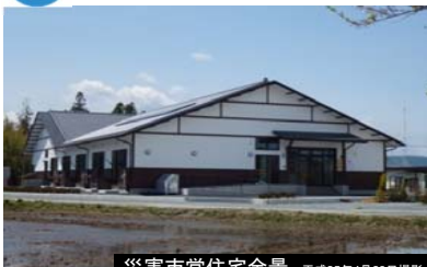
災害市営住宅全景 平成25年4月28日撮影