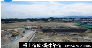
盛土造成・堤体築造 平成25年7月21日撮影