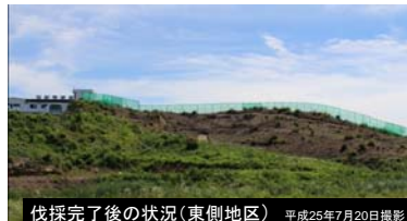
伐採完了後の状況(東側地区) 平成25年7月20日撮影