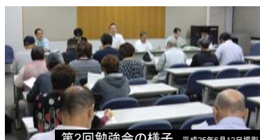
第2回勉強会の様子 平成25年6月12日撮影