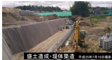
盛土造成・堤体築造 平成25年7月19日撮影