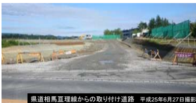
県道相馬互理線からの取り付け道路 平成25年6月27日撮影