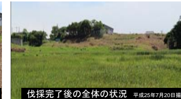
伐採完了後の全体の状況 平成25年7月20日撮影