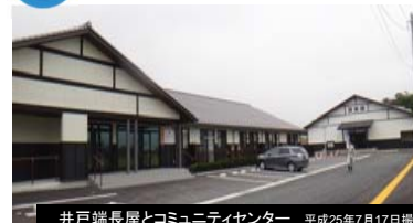
井戸端長屋とコミュニティセンター 平成25年7月17日撮影