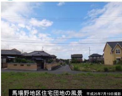
馬場野地区住宅団地の風景 平成25年7月19日撮影