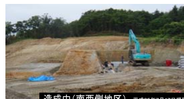
造成中(南西側地区) 平成25年7月17日撮影