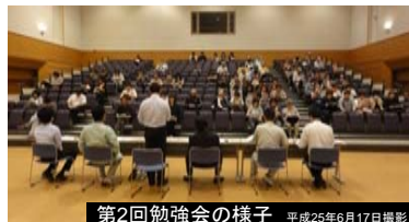
第2回勉強会の様子 平成25年6月17日撮影