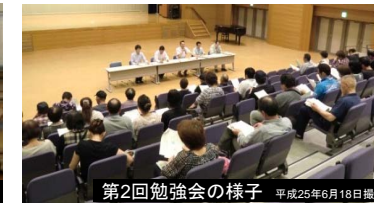
第2回勉強会の様子 平成25年7月18日撮影