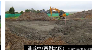
造成中(西側地区) 平成25年7月17日撮影