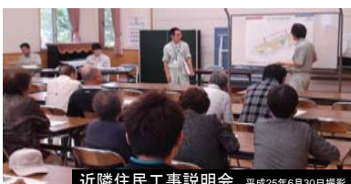
近隣住民工事説明会 平成25年6月30日撮影