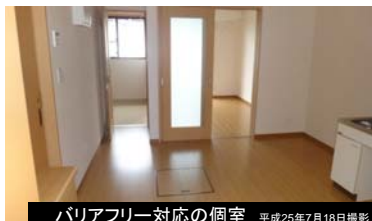
バリアフリー対応の個室 平成25年7月18日撮影