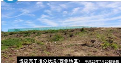
伐採完了後の状況(西側地区) 平成25年7月20日撮影