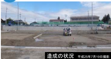
造成の状況 平成25年7月19日撮影