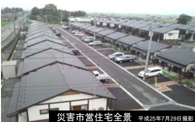
災害市営住宅全景 平成25年7月29日撮影