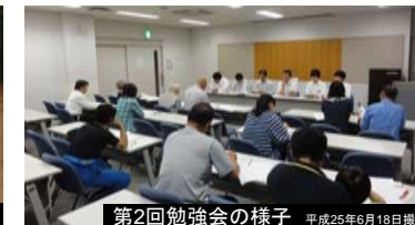
第2回勉強会の様子 平成25年6月18日撮影