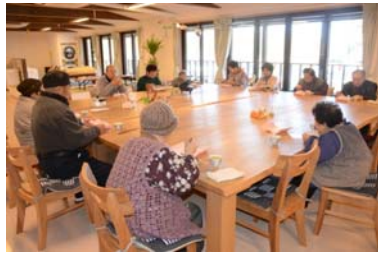
屋食は、入居者全員がそろって、いただきます。