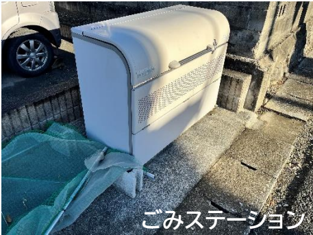
ごみステーション