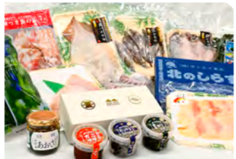
海産物詰め合わせセット (例)

A. 現在、水産物詰め合わせセットという新たな商品を設定したばかりであるため、今後、状況を見ながらその他の商品について検討していく。