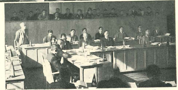
市 議 会 風 景