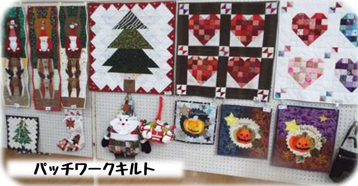
パッチワークキルト

・11/18(土)、11/19(日)に行われた「中央公民館学習展」は、5年ぶりの開催という事もあり、大いに盛り上がりました。 1階「作品展示」では、普段の活動で作り上げたすばらしい作品が一面に飾られました。クレイアート体験もでき、ピンセットで一粒一粒丁寧に土台に刺し可愛いお花ができました。 2階「実技発表」では、楽しい演出とすばらしい演技を見せてくれました。観客も一緒に体験できる時間も設けられ、教室生の動きに合わせて体を動かしていました。たくさんの方に来場していただき、ありがとうございました！