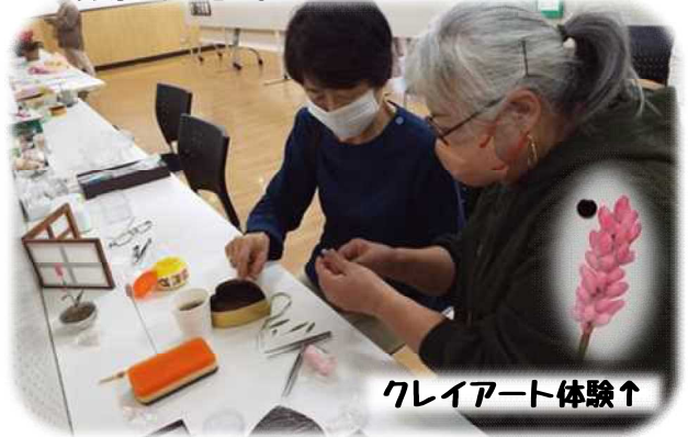
クレイアート体験↑