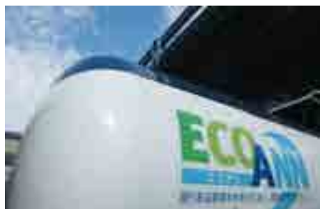
液化アンモニア出荷用ローリータンク