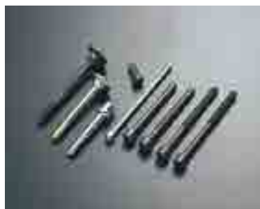
エンジン高機能ボルト

製造工程は、冷間圧造工程、プレス工程、ねじ転造工程、熱処理工程、表面処理工程（メッキ、ジオメット）、検査梱包工程です。