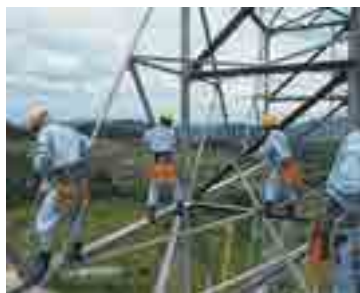
鉄塔の保守管理（タワーメンテナンス）