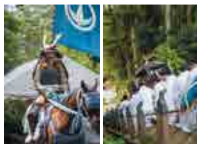
会社として相馬野馬追にも参加