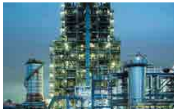
KPR（川崎プラスチックケミカルリサイクルプラント）