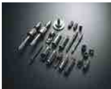
高精度冷間鍛造ギア