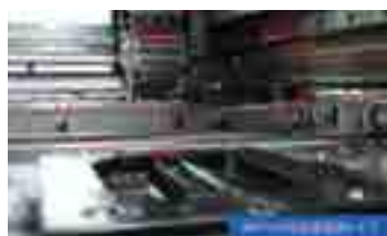
SMT: PWB 表面実装サービス