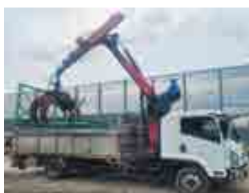
金属くず加工処理等事業