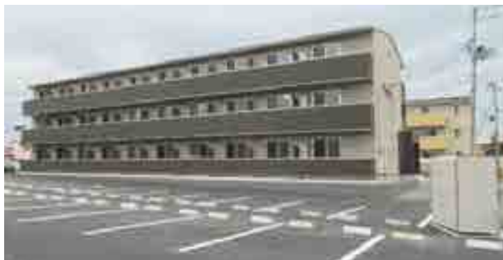
社宅寮の管理業務