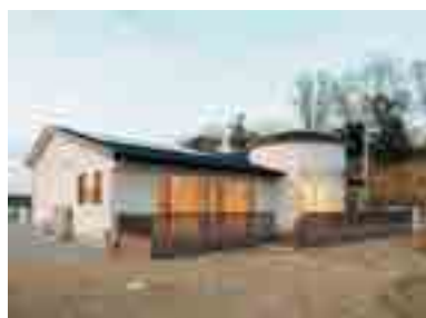
事業所保育所 I☆KIDS そうま