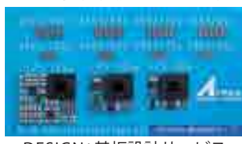
DESIGN: 基板設計サービス