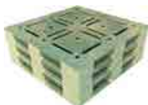
リサイクルパレット製造