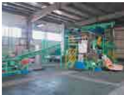
太陽光パネルリサイクル設備