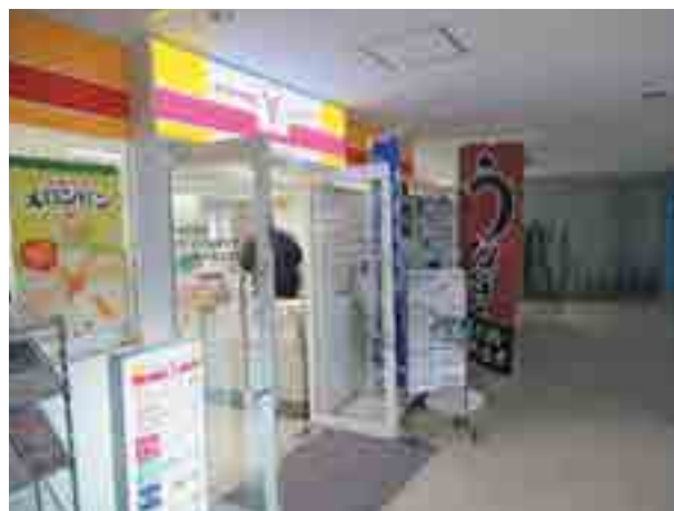
ヤマザキショップ店舗運営