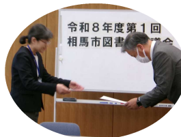
令和8年度第1回 相馬市図書