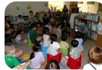
昨年のおはなし会