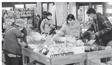
新鮮野菜 100円均一祭の様子

「道の駅そうま」は、公募により選定したシダックス大新東ヒューマンサービス株式会社が令和4年10月より運営しています。同社は複数の「道の駅」の運営に携わっており、その経験を生かした運営で、着実に売り上げを伸ばしています。今後も同社と協議しながら集客を図ってまいります。