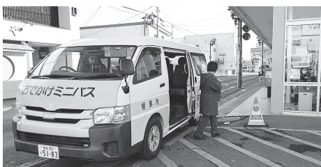
おでかけミニバス運行の様子

今回紹介した手紙のほかにも、今後のまちづくりの参考になる意見が多く寄せられました。