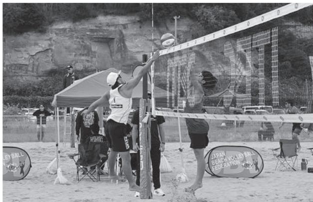
相馬市長杯ジャパンビーチバレーボールツアーの様子