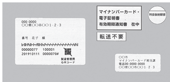
マイナンバーカードなどに関する通知の封筒(見本)

●電子証明書の更新について 今後、電子証明書の更新対象者が増える見込みです。電子証明書の有効期限通知書が届いた方は、予約の上、早めに更新の手続きをお願いいたします。 ※電子証明書の更新には、マイナンバーカードを発行した際に設定した暗証番号が必要です。暗証番号を控えた上で来庁ください。