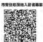
市営住宅団地入居者募集