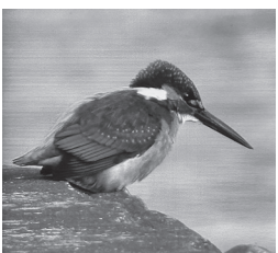
野鳥の会会員が撮影したカワセミ