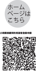
ホームページはこちら