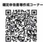
確定申告書等作成コーナー