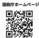
国税庁ホームページ