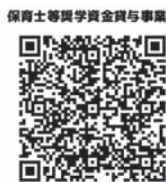
保育士等奨学資金貸与事業