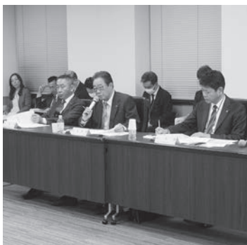
●問い合わせ先 秘書課 (☎372115)

▽ALPS処理水の海洋放出について、相馬市でも中国から嫌がらせの電話が多数あり、「風評被害もどき」のようなことがあった。しかしながら、全国からの応援をいただき、嫌がらせに負けてなるものかという気持ちが生まれ、風評払拭も兼ねて浜の駅松川浦を増築しようと考えている。地方の一つ一つの自治体がそれぞれの問題を抱えているので、国として支援いただけるようお願いしたい。