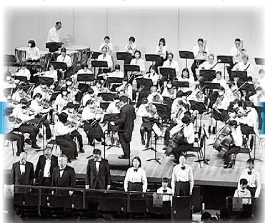
外部団体と連携した 事業の継続・発展