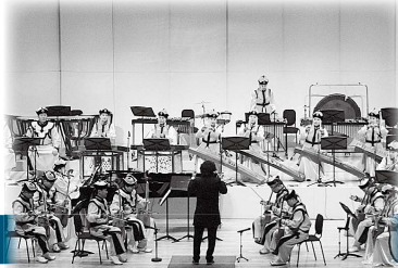
モンゴル国立馬頭琴交響 楽団演奏会 (平成 28 年 10 月 28 日)