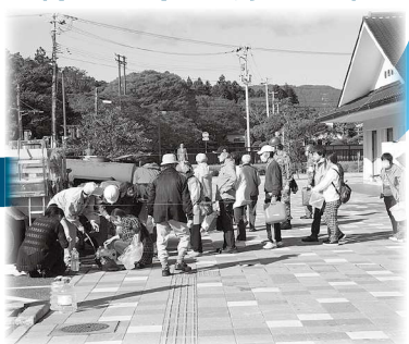
災害時の支援拠点