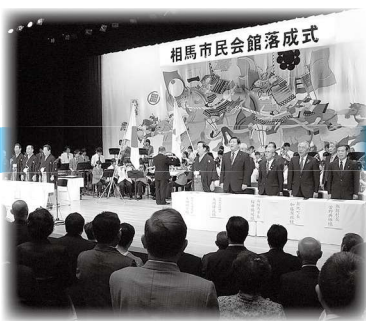
市民会館落成式 (平成 25 年 10 月 7 日)