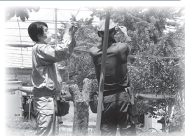
ナシの農業研修の様子