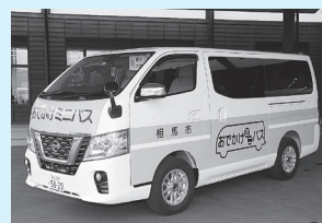
おでかけミニバス

市は、自らの移動手段を持たない高齢者の方々の移動手段の確保と中心市街地活性化を目的に、 無料の「おでかけミニバス」を運行しています。現在は週2回20ルートに拡充し、運行しています。 おでかけミニバスの経路や運行回数などは区長会や運転をお願いしているタクシー利用促進協 会と相談を重ねて決めているところですが、今後も協議の上、要望にお応えできるよう検討して いきます。利用方法などは企画政策課まで気軽に問い合わせください。