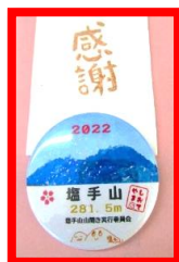
塩手山記念バッジ