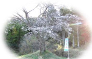
塩手山麓の四季桜

11月23日（祝日）勤労感謝の日に塩手山は、日本で一番遅い山開きを行います。四季桜が咲くちょうど見ごろの時に山開きが行われます。