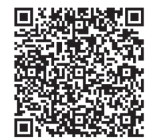
ふくしま復興ステーション