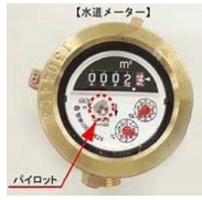
パイロットマークの外観