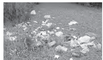
空き地にポイ捨てされたごみ