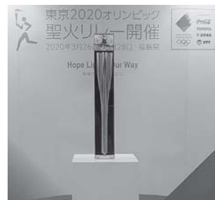
聖火リレートーチ

聖火リレースタートまで あと100日 ※Jヴィレッジを令和3年 3月25日スタート。