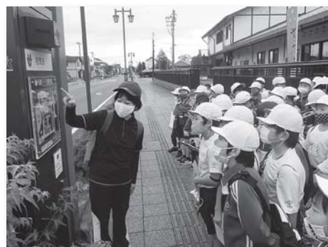
視覚障がい者用音声案内装置と点字ブロック（中央公民館北側）

相馬のまちの中を見て歩き、スロープがさまざまな所につくられていたことに初めて気が付きました。点字ブロックがたくさんありました。途切れることなくつながっていると、目が見えない人にとっても、さらに分かりやすくなると思いました。音が出る信号もあって、みんなに優しい工夫がたくさんあることを知りました。