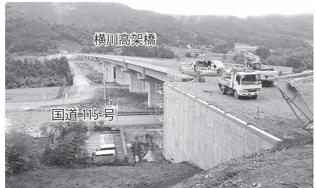
横川高架橋の擁壁の一部が完成しました