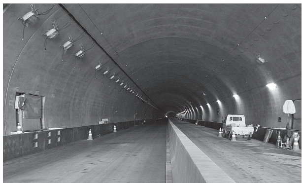
舗装および中央分離帯が完成しました