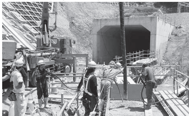
相馬山上IC(オフランプ)

●問い合わせ先 国土交通省東北地方整備局磐城国道事務所 相馬出張所(☎35-1145)