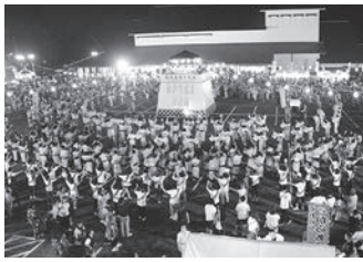
昨年の相馬盆踊り大会

●申込・問い合わせ先 相馬夏まつり運営委員会事務局(市観光協会) (☎353330)