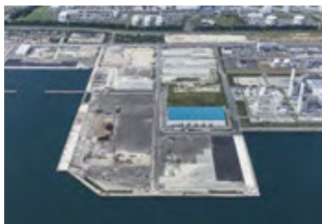
相馬港3号ふ頭

市としては、今後も、相馬港の機能強化とコンテナ輸送再開に向けて、国、県との連携をより一層密にしながら、更なるポートセールスと港湾施設整備の要望活動に努めていく。