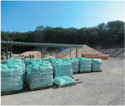
オープンに向け、急ピッチで整備が進む初野射撃場