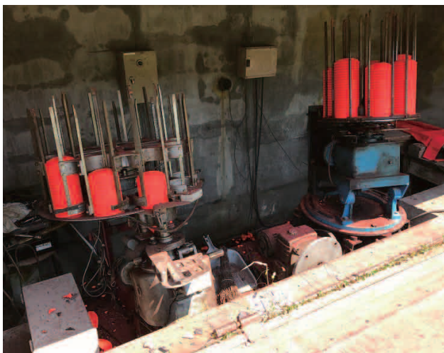
ダブルトラップ競技用に再利用する予定の既存トラップ放出機

また、既存の機械にかなり古い物もあるが、猟友会で整備した後、市に寄付したいとのことである。