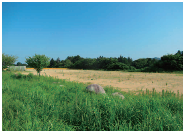
整備予定のM8区画（仮設住宅跡地）

初野射撃場において、バックストップという弾が突き刺さる土手部分についての整備を切土で想定していたが、工事を進