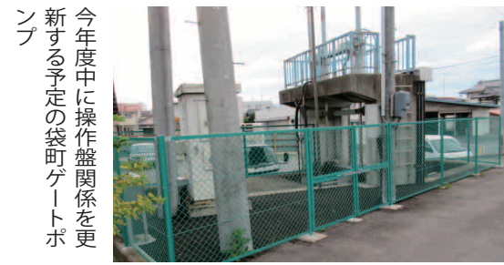
今年度中に操作盤関係を更新する予定の袋町ゲートポンプ