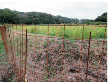
農地の周囲に設置されたワイヤーメッシュ柵（磯部地区）