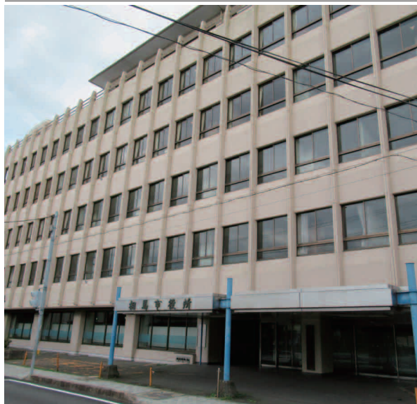
40年間市民に親しまれてきた旧相馬市役所庁舎

で対応している。今年6月補正で議決したとおり、庁舎整備事業、限度額2億7、730万円の起債を予定している。起債のうち、地方交付税で70%が措置される事になっている。