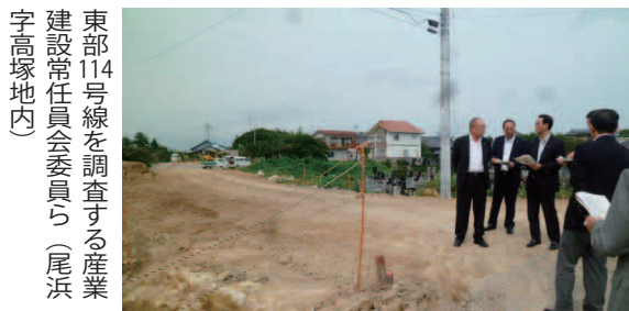
東部114号線を調査する産業建設常任委員会委員ら(尾浜字高塚地内)