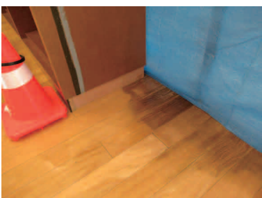
腐食により変色した床（伝承鎮魂祈念館）

変色の原因は、結露による湿気での腐食により、変色したものと思われるので、カーペットに変え、通気性のよい仕上げで修繕する内容である。