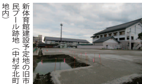
新体育館建設予定地の旧市民プール跡地（中村字北町地内）