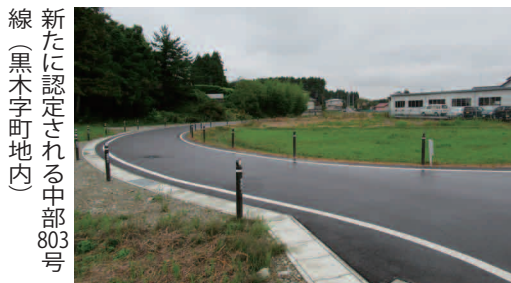
新たに認定される中部803号線(黒木字町地内)