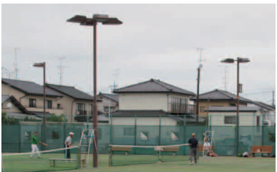
多くの市民に利用されている角田公園

中学校やテニス協会等の利用者より7、8コートについて夜間も利用したいとの要望が多いことから整備をするものである。