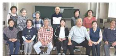
ニュースポーツ教室