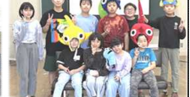
eスポーツコミュニティ