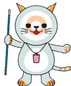
「フキヤット」 ©日本スポーツウエルネス吹矢協会 協会公式マスコット