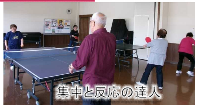
集中と反応の達人