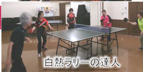
白熱ラリーの達人

5月より各教室の開講式を行いました。注意：〇〇の達人は1年よろしく願っています。個人の感想です