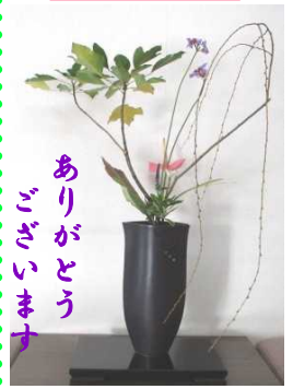
ありがとうございます