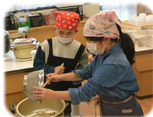
「お肉を炒めている」様子