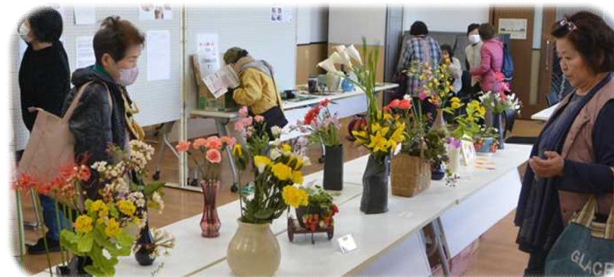
「本物と間違えそうな程のリアルな大人の粘土作品」