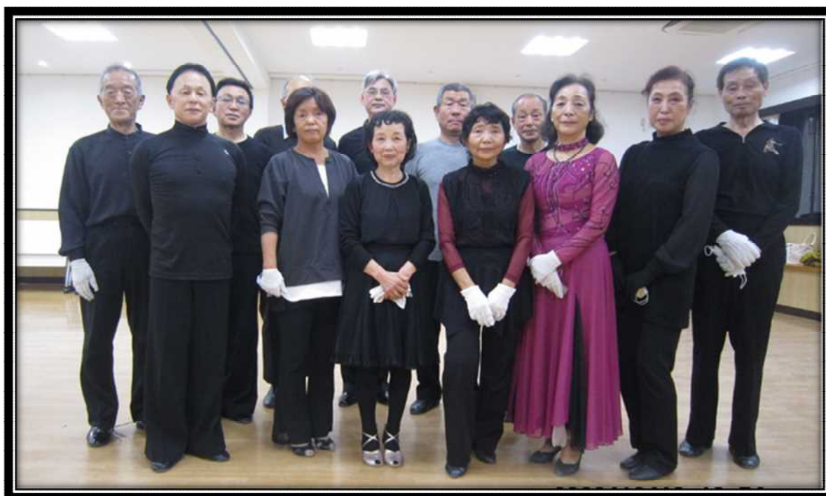
社交ダンス教室の皆さん

現在は、パートナーとも距離を確保し、マスクを着用することで、新型コロナウイルス感染拡大予防に努めて練習しております。