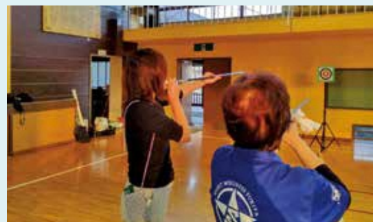
▲スポーツウェルネス吹矢の出前講座

市民の皆さんが主催する勉強会や会合などの場所に、市役所職員や市民ボランティアが講師として出向き、講座を行います。メニュー数は79種類（令和5年度現在）、講師料は無料です。