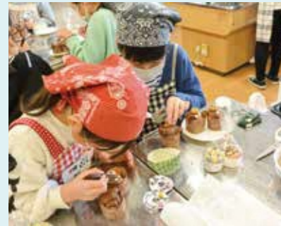
▲中央こども教室 (アニマルスイーツ作り)