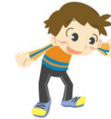
Qちゃん 市内在住の小学生