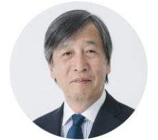
早野龍五先生 東京大学名誉教授 放射線のプロ