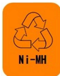
ニッケル水素 電池