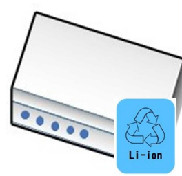
モバイル バッテリー (リサイクルマーク付き)

※リサイクルマークの無いもの、膨張している・熱を持っているもの、充電電池が取り外せない製品は回収できないため、「相馬リサイクルセンター」に持ち込んでください。(有料となります。) 連絡先: 相馬リサイクルセンター 0244-63-2088