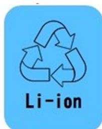
リチウムイオン 電池